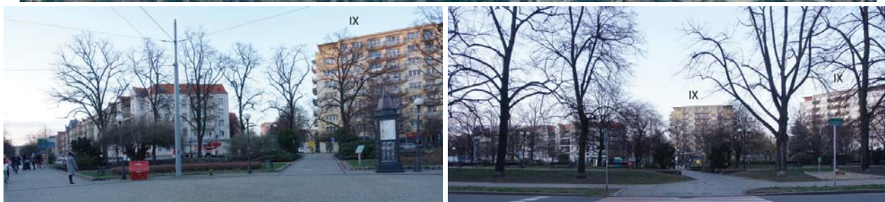
Il. 5. Fragment Szczecina w zasięgu 500 metrów (zielony okrąg). Zdjęcia przedstawiają fragment zabudowy z widokiem na budynki zaznaczone na mapie 'IX' (jest to ilość kondygnacji).