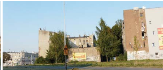
Il. 4. Fragment Łodzi w zasięgu 500 metrów (zielony okrąg) z podaniem ilości kondygnacji istniejącej zabudowy. Zdjęcia przedstawiają fragment zabudowy zaznaczony na mapie jako 'ZM'.