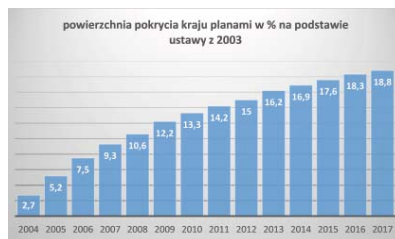
Il. 2. Powierzchnia Polski pokryta miejscowymi planami, które były sporządzone na podstawie ustawy z 2003 roku.