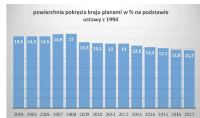
Il. 3. Powierzchnia Polski pokryta miejscowymi planami, które były sporządzone na podstawie ustawy, która weszła w życie w 1995 roku.