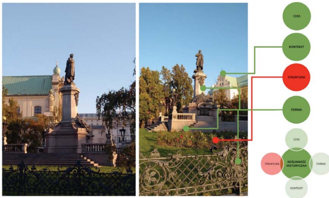
II. 2. Skwer Adama Mickiewicza w Warszawie — weryfikacja kryteriów oceny autentyczności formy roślinności historycznej.