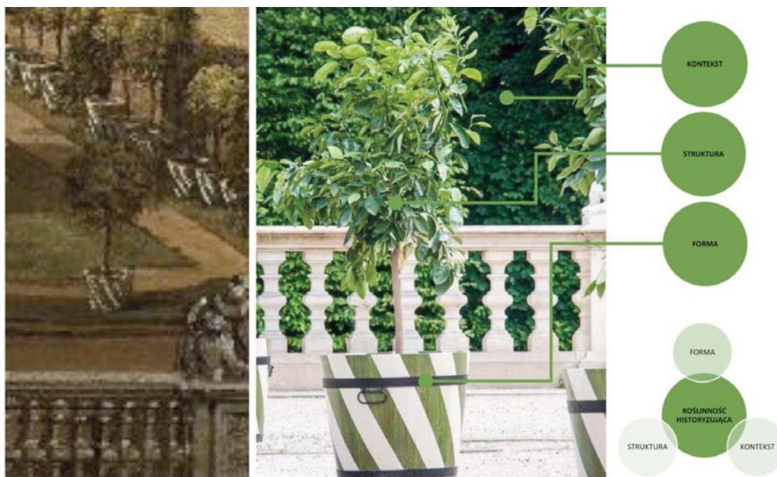
Il. 5. Element wyposażenia salonu ogrodowego na tarasie górnym przy pałacu w Wilanowie — kadr z obrazu Bernarda Bellotta Pałac w Wilanowie od strony ogrodu — 1776 w zestawieniu ze zdjęciem efektu odtworzenia historycznych pojemników na cytrusy. Weryfikacja kryteriów oceny autentyczności formy roślinności historyzującej. Grafika: Łukasz Przybylak.

Jednym z przykładów działań, mających na celu przywrócenie i utrzymanie w stanie autentycznym