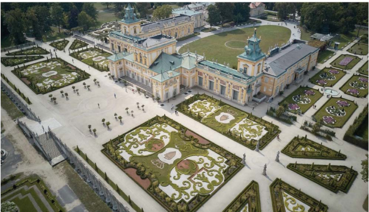
Il. 4. Widok z lotu ptaka na salon ogrodowy tarasu górnego przy Pałacu w Wilanowie. Widoczny jest także Ogród Północny przy Pałacu oraz Ogród Południowy. Stan po rewaloryzacji z lat 2009–2011 ilustruje utrzymanie przestrzennych wartości kompozycyjnych datowanych na koniec XVII wieku.

W ujęciu wartości kompozycyjnych rezydencji wilanowskiej, do poddawanych ochronie należą także te niematerialne. Pięcioliniowy układ głównych osi kompozycji przestrzennej, na które w XVII wieku nanizany został pałac oraz towarzyszące mu ogrody ozdobne i zabudowania folwarczne, przetrwał w niezmienionym stanie do czasów współczesnych. Utrzymanie osiowego układu w przestrzeni rezydencji wilanowskiej, szczególnie w obliczu XIX-wiecznej rearanżacji inicjowanej przez rodzinę Potockich, nie było oczywiste. Układ kompozycyjny utrzymał się wówczas dzięki świadomości jego wartości. Wiedziony podobnymi pobudkami profesor Gerard Ciołek przyczynił się z kolei w latach powojennych XX wieku także do zachowania przebiegu pięciu głównych osi kompozycji przestrzennej. Pochodną