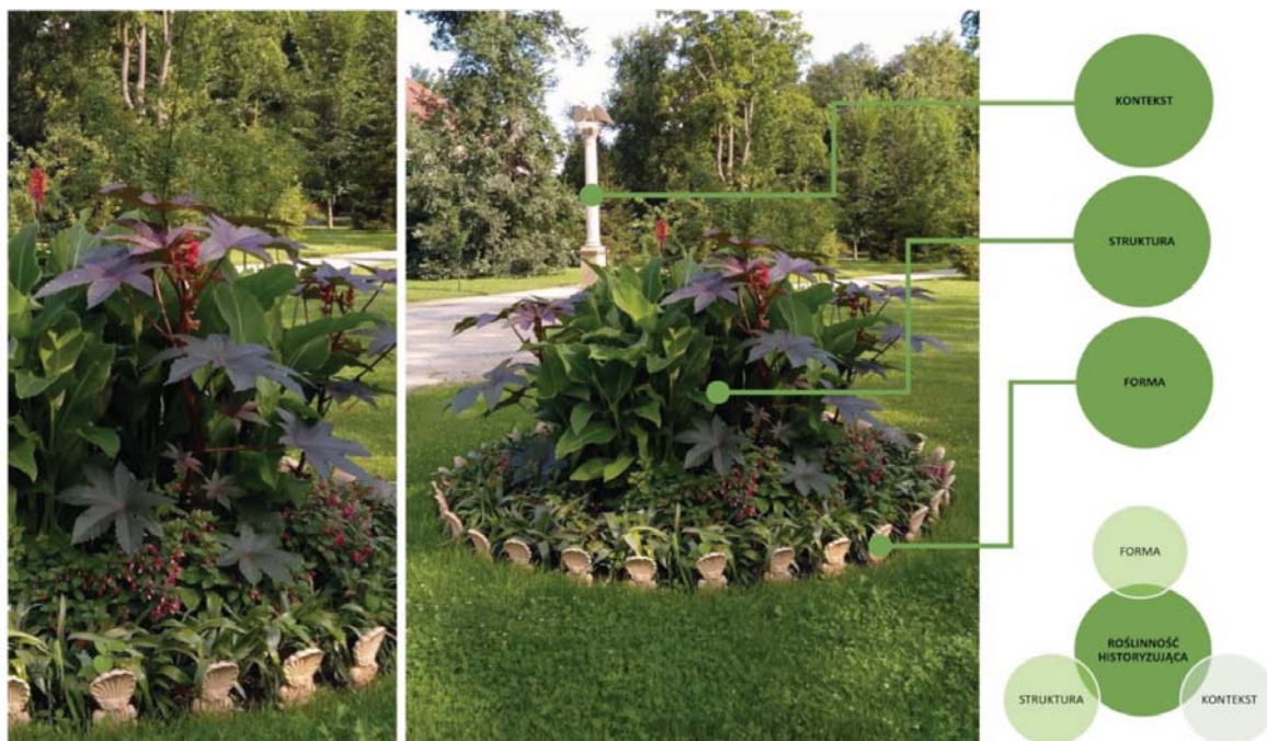
Il. 6. Rekonstrukcja XIX-wiecznego klombu liściastego typu angielskiego wraz z dekoracyjną, ceramiczną bordiurą. Lokalizacja wtórna przy Kolumnie z Orłem w Północnym Parku Krajobrazowym Muzeum Pałacu Króla Jana III w Wilanowie. Grafika: Łukasz Przybylak.

Pierwszym czynnikiem, który wyparł dziewiętnastowieczne kwietniki i klomby z przestrzeni ogro-