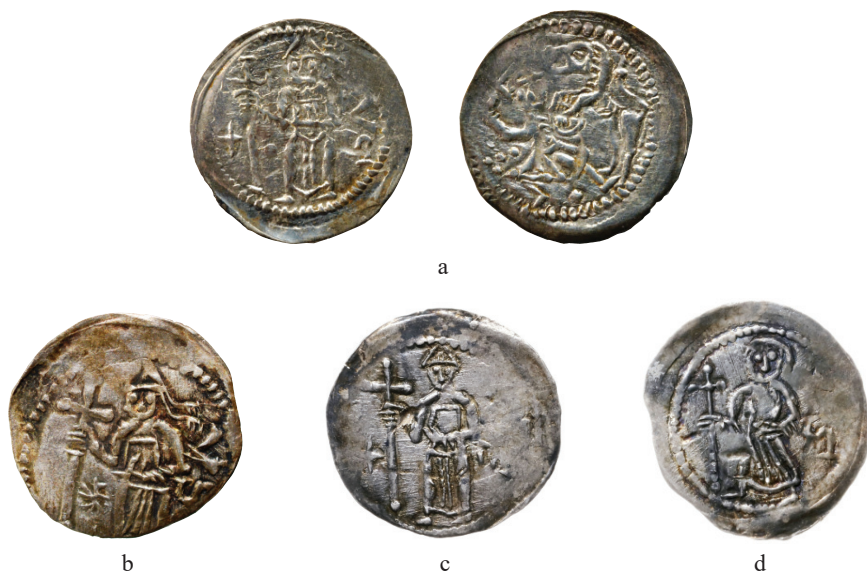
Ryc. 1. Denary Str. 46 biskup z krzyżem / walka z lwem ze skarbu z Głogowa II, fot. autor: a. Av. Stojący na wprost biskup w jednoróżnej infule z pendiliami, w prawej ręce dzierży krzyż na długim drzewcu, ramiona krzyża zakończone są poprzeczkami, w polu po prawej litery SA, z lewej przedzielone drzewcem krzyżyk i kulka; rv. Scena walki rycerza z lwem: z lewej rycerz w krótkiej kiecicy wznosi ponad głowę prawicę z mieczem, w lewym ręku dzierży okrągłą tarczę, prawa noga ugięta w kolanie, lewa wyprostowana w wyroku do przodu; z prawej wspięty na tylnych nogach lew z zadartym do góry ogonem opiera przednie łapy na tarczy, jego głowa z otwartym pyskiem góruje nad rycerzem, w polu z lewej pięć kulek, między stopami rycerza jedna kulka, 0,350 g, ID 596; b. Jak wyżej, lecz na av. krzyż z kulkami na końcach ramion, 0,387 g, ID 600; c. Jak wyżej, lecz na av. infuła bez wstęg, 0,33 g, WCN 135155; d. Jak wyżej, lecz na av. biskup bez nakrycia głowy, 0,28 g, WCN 140340.

Na awersie przedstawiono postać biskupa en face , najczęściej w infule z pendiliami, z krzyżem na długim drzewcu w prawej ręce i Ewangelią opartą o pierś w lewej; rewers przedstawia scenę dynamicznej walki rycerza z lwem 3 . Krzyż, który jest głównym atrybutem osoby przedstawionej na wszystkich odmianach tego typu monet, występuje w dwóch zasadniczych formach: z poprzeczkami (a) lub kulkami na końcach ramion (b). W polu awersu po prawej stronie umieszczono litery SA, ponadto na części monet występują znaki mennicze w postaci krzyżyka, kulki, gwiazdki lub pięciu kulek 4 .