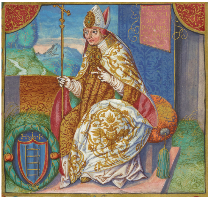
Ryc. 2. Abp Henryk Kietlicz 1199–1219 . Miniatura ok. 1535 r. Herb zmyślony („Drabina do nieba” ze snu św. Jakuba?), wg Jan Długosz, Catalogus archiepiscoporum Gnesnensium , Kraków 1531–1535 ( http://polona.pl/item/36618320 )

Postaram się wykazać, że typ monet Str. 46 przedstawia arcybiskupa gnieźnieńskiego Henryka Kietlicza (1199–1219) (ryc. 2), a denary mogły być bite od wiosny 1207 do końca 1211 r., przypuszczalnie w mennicy głogowskiej, legnickiej bądź wrocławskiej Henryka Brodatego, księcia śląskiego.