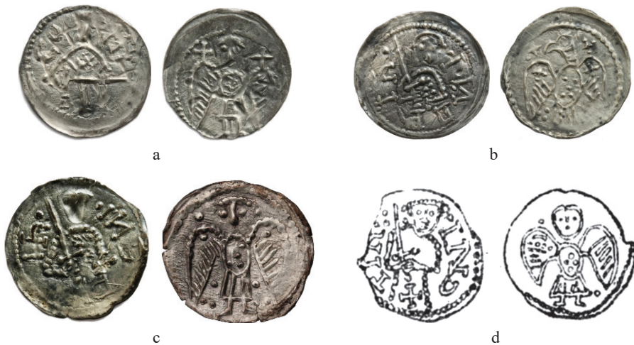
Ryc. 7. Denary współbiegające z monetami abpa Henryka Kietlicza, a. Denar Mieszka Płatonogiego z lat 1202–1211, av. książę na tronie z mieczem na kolanach, rv. anioł, 0,298 g, m. Głogów, MG/N/166/13557, Su 63 a; b. Denar typu A Henryka Brodatego z lat 1202–1211?, podtyp A, av. popiersie księcia z mieczem na ramieniu, 0,286 g, m. Głogów, MG/N/166/13576, rv. orzeł, 0,322 g, m. Głogów, MG/N/166/13621, Su. 5a; c. Denar typu B Henryka Brodatego z lat 1202–1211?, podtyp B, av. jak wyżej, 0,262 g, m. Głogów MG/N/166/13490, rv. anioł, 0,200 g, m. Głogów, MG/N/166/5464, Su. 4c; d. Denar typu C Henryka Brodatego po 1207 r.?, podtyp C, av. książę w całej postaci Wi 64 14, 0,12 g, Su. 5c, rv. anioł Wi 5, 0,15 g, Su. 4c.