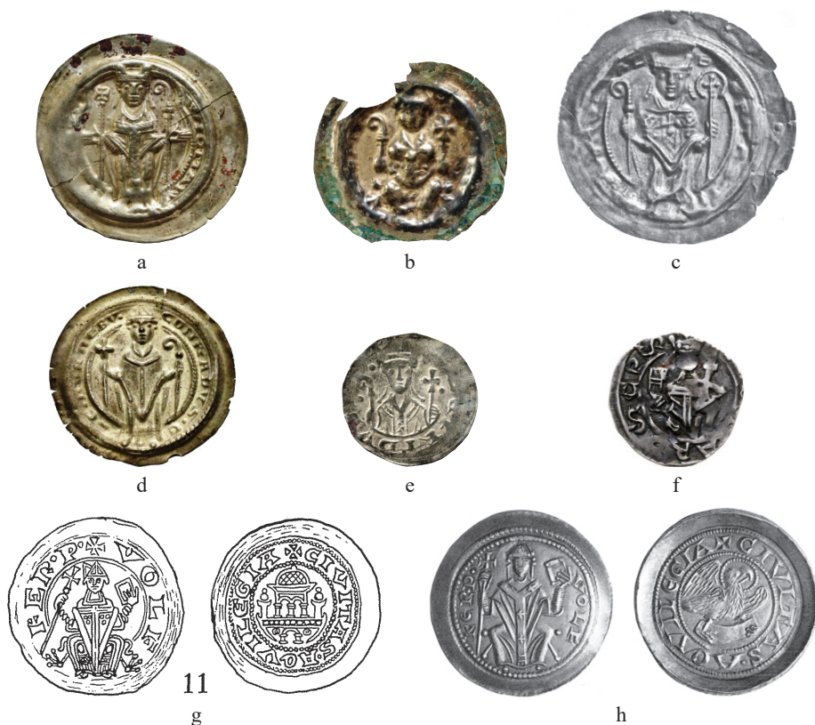
Ryc. 6:a–h. Przykładowe monety, na których emitenci przedstawieni są z długim krzyżem.