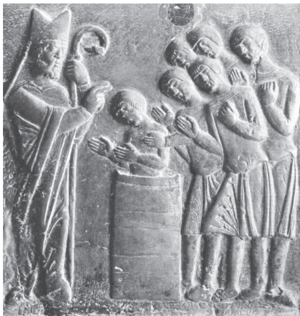
Ryc. 4:f. Drzwi gnieźnieńskie, 2. poł. XII w., kwatera XII, Chrzest Prusów , fot. autor.

Postacią na monecie nie jest późniejszy św. Stanisław 13 . Na monetach temat św. Stanisława pojawia się w 2. połowie XIII w., na denarze Bolesława Wstydlivego (Str. 50). Jego przedkanonizacyjny kult rozwija się dopiero w 2. ćwierci tego wieku, inspirowany Kroniką biskupa Wincentego Kadłubka 14 . Według Stanisława Szczura 15 starania o kanonizację bpa Stanisława rozpoczął bp krakowski Iwo Odrowąż (1218–1229), za którego rządów zaczęto zbierać pierwsze świadectwa o zamordowanym. Wincenty z Kielc, późniejszy autor jego żywotów miał wówczas odwiedzić Szczepanów, według tradycji miejsce urodzin bpa Stanisława. Kolejny etap zabiegów przypada na czas biskupa Prędoty (1242–1266). Według B. Paszkiewicza 16 św. Stanisław nigdzie nie jest przedstawiany z krzyżem.