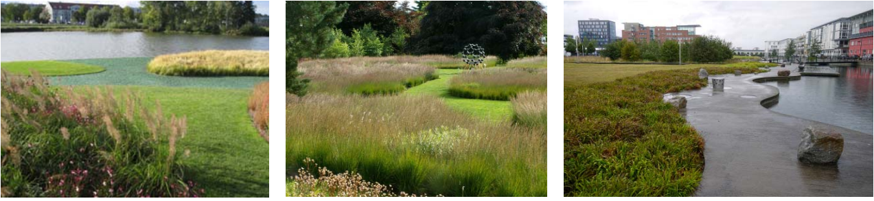
Ryc. 12. c/ Wystawa Ogrodowa BUGA, Schwerin 2009, fot. A. Zachariasz; b/ Piet Oudolf, Trentham Gardens – “Rivers of Grass”, http://acousticgardens.blogspot.com/2010/09/sunny-day-at-last.html , retrieved on 07.2017; c/ Anchor Park w Västre Hamnen w Malmö, fot. A. Zachariasz