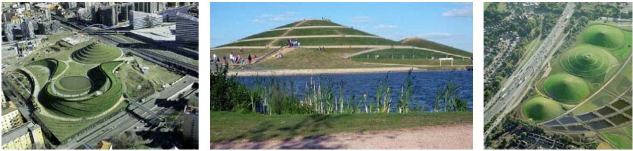
Ryc. 7. a/ Parco Portello w Mediolanie, http://www.100kmdamilano.it/il-giardino-del-tempo-nel-parco-del-portello/ , dostęp 06. 2017; b/ i c/ Northala Field w Londynie, b/ https://londonist.com/2011/05/nature-ist-northala-fields , c/ http://www.public-art-directory.com/northala-fields-london-created-by-artist-peter-fink-and-landscape-architect-igor-marko-artist-101.html ; dostęp 06. 2017

Fig. 7. a/ Parco Portello in Milan, http://www.100kmdamilano.it/il-giardino-del-tempo-nel-parco-del-portello/ , retrieved on 06. 2017; b/ and c/ Northala Field in London, b/ https://londonist.com/2011/05/nature-ist-northala-fields , c/ http://www.public-art-directory.com/northala-fields-london-created-by-artist-peter-fink-and-landscape-architect-igor-marko-artist-101.html ; retrieved on 06. 2017