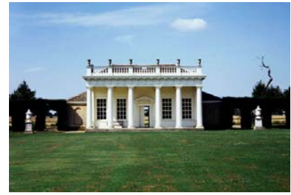
Ryc. 9. a/ Drzeworyt pokazujący trawnik do gry w kule, za: R.Hart, English Life in Tudor Times , NT: Putnam, 1972, Author Unknown, https://commons.wikimedia.org/wiki/File:Woodcut_Bowling_16th_century.jpg ; dostęp 06.2017; b/ Hanbury Hall z Bowling Green, ryc. Sir James Thornhill; https://www.nationaltrust.org.uk/features/11eorge-london-designer-of-dreams , dostęp 06.2017; c/ Bowling-Green House z rozległym trawnikiem przed obiektem w Wrest Park w Bedfordshire, fot. A. Zachariasz

Fig. 9. a/ A woodcut depicting a lawn for bowling, after: R.Hart, English Life in Tudor Times , NT: Putnam, 1972, Author Unknown, https://commons.wikimedia.org/wiki/File:Woodcut_Bowling_16th_century.jpg ; retrieved on 06.2017; b/ Hanbury Hall with a Bowling Green, fig. Sir James Thornhill; https://www.nationaltrust.org.uk/features/eorge-london-designer-of-dreams , retrieved on 06.2017; c/ Bowling-Green House with an expansive lawn in front of the building in Wrest Park, Bedfordshire, phot. by A. Zachariasz