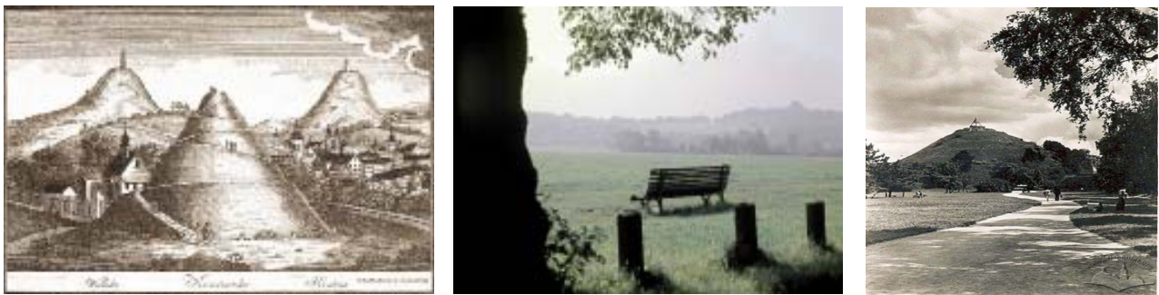
Ryc. 3. a) Trzy Kopce w Krakowie – Wandy, Kościuszki i Krakusa (1830); b) Kopiec Kościuszki w Krakowie, widziany z Błonia, fot. A. Böhm; c) Kopiec Unii Lubelskiej we Lwowie (1869) http://www.lvivcenter.org/pl/uid/picture/?pictureid=56 , dostęp 06.2017