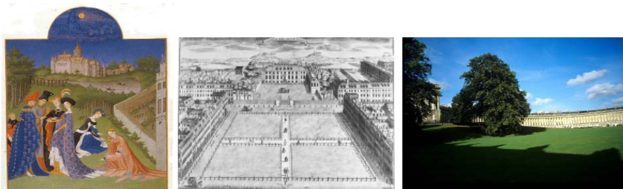
Ryc. 1. a) Godzinki księcia de Berry – Modlitewnik, (bracia Limbourg), kwiecień, pocz. XV w.; b) Bloomsbury Square i Bedford House ok. 1725, https://de.wikipedia.org/wiki/Bloomsbury_Square, dostęp 05.2017; c) Royal Crescent, Bath, John Wood Młodszy, 1767-1774

Fig. 1. a) Très Riches Heures du Duc de Berry – a book of hours (Limbourg brothers), April, beginning of the XV century; b) Bloomsbury Square and Bedford House around 1725, https://de.wikipedia.org/wiki/Bloomsbury_Square, retrieved on 05.2017; c) Royal Crescent, Bath, John Wood the Younger, 1767–1774