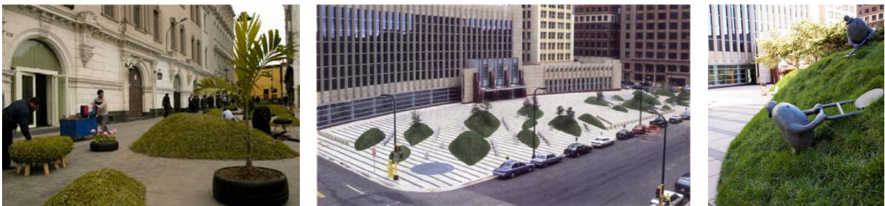
Ryc. 8. a/ Invasión Verde, Lima, Peru, park, który „wyskoczył na ulicy”; http://www.plataformaarquitectura.cl/cl/02-59367/invasion-verde-genaro-alva-claudia-ampuero-denise-ampuero-gloria-rojas ; dostęp 06. 2017; b/ i c/ Courthouse plaza, Minneapolis; Martha Schwartz, z rzeźbami Toma Otterensa „zaludniającymi” trawiaste drumliny; http://landscapevoice.com/minneapolis-u-s-courthouse-plaza/ ; dostęp 06. 2017.

Fig. 7. a/ Parco Portello in Milan, http://www.100kmdamilano.it/il-giardino-del-tempo-nel-parco-del-portello/ , retrieved on 06. 2017; b/ and c/ Northala Field in London, b/ https://londonist.com/2011/05/nature-ist-northala-fields , c/ http://www.public-art-directory.com/northala-fields-london-created-by-artist-peter-fink-and-landscape-architect-igor-marko-artist-101.html ; retrieved on 06. 2017