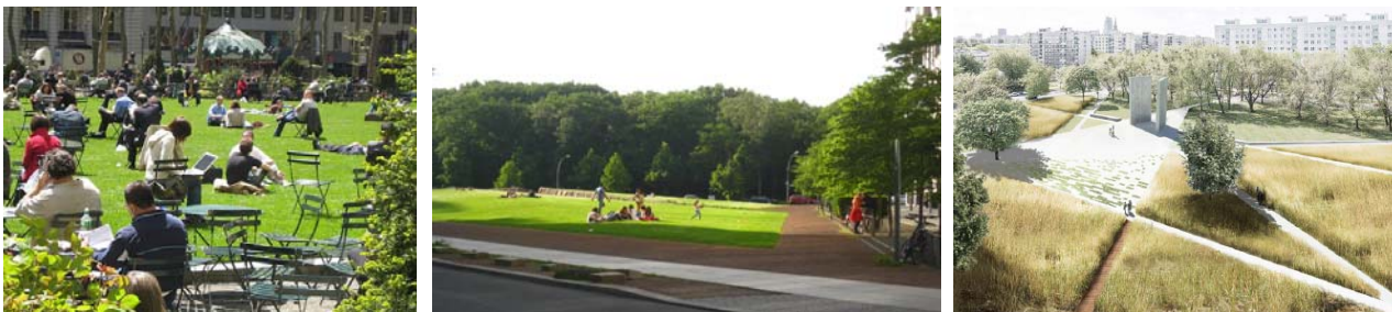
Ryc. 2. a) Bryant Park, Nowy Jork, fot. E. Prokop; b) Henriette Herz Park przy Potsdamer Platz w Berlinie, fot. A. Zachariasz; c) Łąka jako forma symboliczna, konkurs „Ratującym – Ocaleni” (K. Jakubowski, J. Kolarz-Piotrowicz, Ł. Malec), http://www.a-ronet.pl/ , dostęp 06.2016