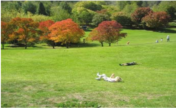
Ryc. 13. Wielka łąka w parku publicznym może dać wiele radości, fot. M. Zachariasz