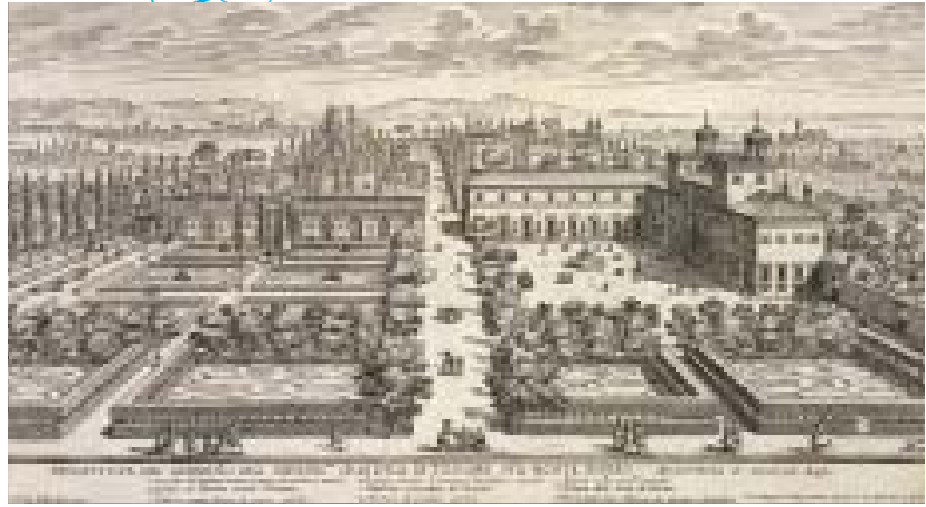
Ryc. 4. a) Widok rezydencji w Łobzowie z kopcem w jednej z kwater, fragment panoramy Krakowa z dzieła G. Brauna i F. Hogenberga, Civitates orbis terrarum. Theatri praecipuarum totus mundi urbium... (1603–1605), tabl. 43, Kolonia 1617, ryc. Egidius van der Rye; b) Perspektywa rzymskiej willi Medyceuszy na Monte Pincio, w głębi widoczny kopiec obsadzony drzewami, za: Li giardini di Roma: con le loro piante alzate e vedute in prospettiva, ryc. Giovanni Battista Falda 1683

Fig. 4. a) A view of the residence in Łobzów with a mound in one of the quarters, a fragment of a panorama of Krakow from the work of G. Braun and F. Hogenberg, Civitates orbis terrarum. Theatri praecipuarum totus mundi urbium... (1603–1605), tabl. 43, Cologne 1617, fig. by Egidius van der Rye; b) A perspective view of the Medici family Roman villa on Monte Pincio, a mound can be seen in the background, after: Li giardini di Roma: con le loro piante alzate e vedute in prospettiva fig. by Giovanni Battista Falda 1683