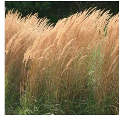
Ryc 11. a/ Trawa pampasowa ( Cortaderia selloana ), rycina z poł. XIX w. pokazująca nową egzotyczną roślinę; ze zbiorów A. Zachariasz; b/ Trawa pampasowa w Sheffield Park; https://commons.wikimedia.org/wiki/File:SHEFFIELD_PARK_GARDENS ; dostęp 06.2017; c/ Trzcinnik ostrokwiatowy 'Karl Foerster' Calamagrostis x acutiflora 'Karl Foerster' https://www.mygardeninsider.com/the-gardeners-library/3431/calamagrostis/x-acutiflora/karl-foerster ; dostęp 06.2017