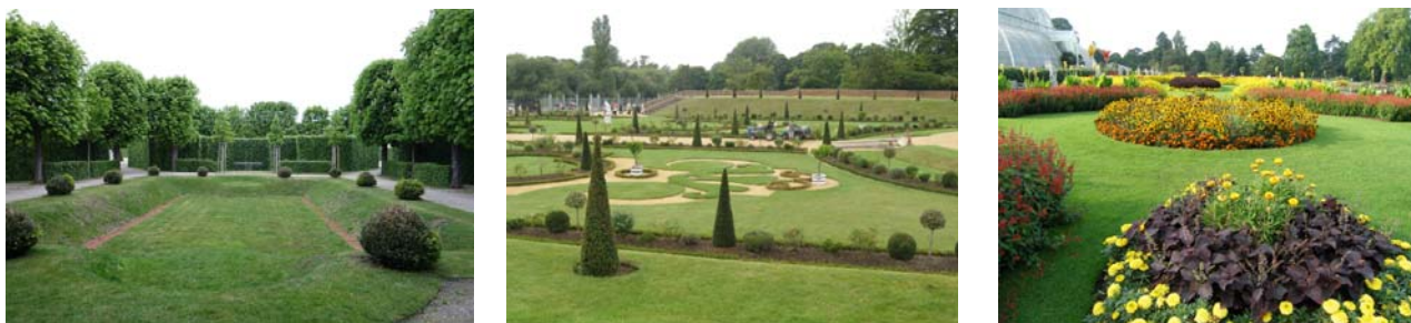
Ryc. 10. a/ Wgłębnik ( boulingrin fr.) w wiedeńskim ogrodzie Belweder; b/ Parter angielski w Privy Garden w Hampton Court; c/ Partery dywanowe w londyńskim Kew Garden