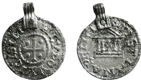
Ryc. 1. Janów Pomorski, denar Ludwika Pobożnego. Skala 1,5:1.

Cesarstwo Karolińskie , Ludwik Pobożny (814–840), mennica nieokreślona, denar z lat 822–840. Av.: w polu krzyż równoramienny z rozszerzonymi końcami, z punktami między ramionami, obwódki perełkowe, w otoku [+]HLVDOVVICVSIMP; Prou 6 1009; Morrison, Grunthal 7 472; MEC 1 8 , 800. Rv.: w polu kaplica z krzyżem między 4 kolumnami z zaznaczonymi kapitelami, w otoku +PISTIANARELIGI[O]; Prou 1002/9 (lecz poprzeczki w A), Morrison, Grunthal 472, MEC 1, 802 (lecz inne kolumny). Do monety zostało przynitowane srebrne uszko o wymiarach 3,4 na 17 mm. Waga 1,5 g, średnica 23–29 mm. Monetę znaleziono na obszarze polderu nr 1, ar XXI/14 (Ryc. 2).