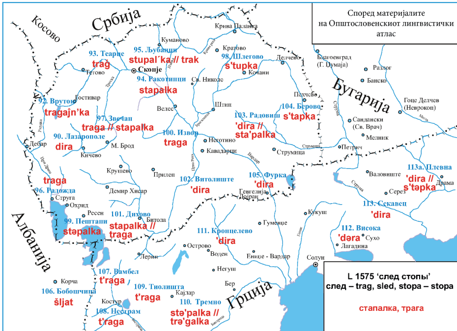
Карта 2: Дијалектни називи за 'стапалка, трага' на македонскиот јазичен ареал (според ОЈА).