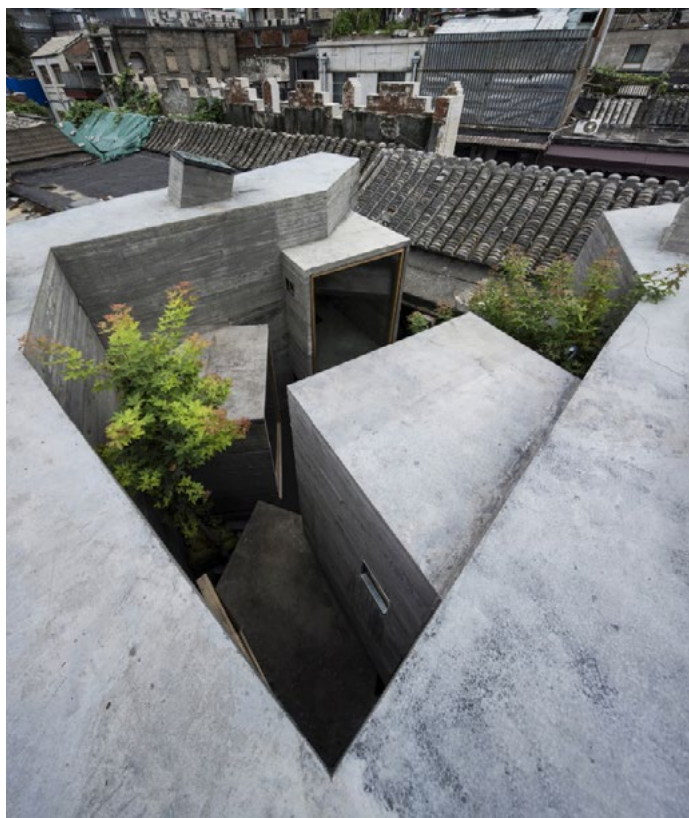
Il. 5, 6. Mikro Hutong, arch. ZAO/Standardarchitecture, Fot. Wang Ziling