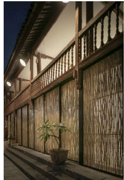
II. 7, 8, 9. Restauracja Chaimiduo i bazar agro-kulturalny, Zhao Yang Architects, fot. Chun Fang, Pengfei Wang