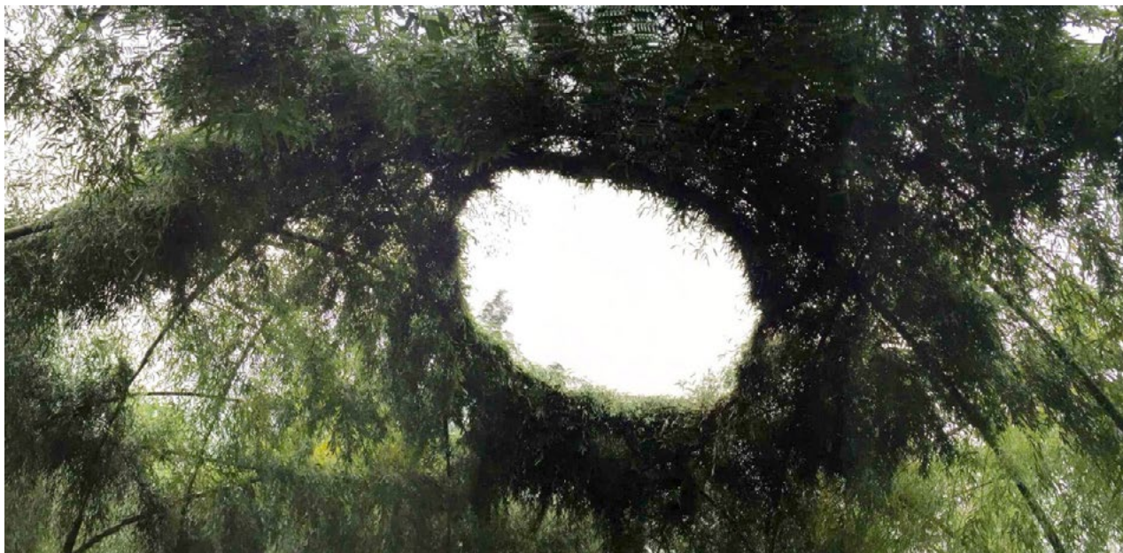
II. 10,11,12. Teatr Bambusowy, arch. DNA_Design and Architecture