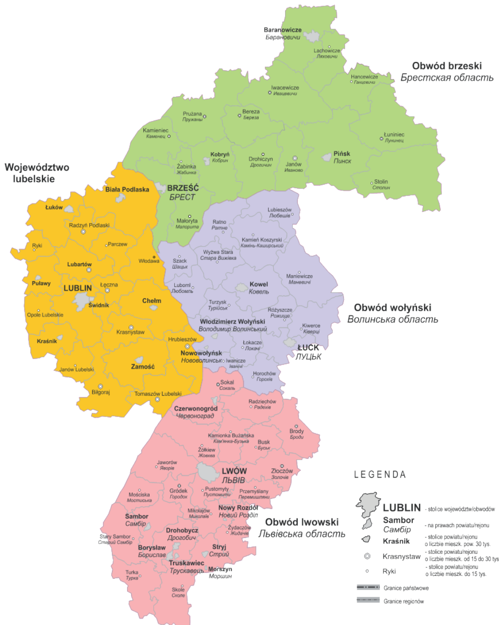
Ryc. 1. Podział administracyjny regionu transgranicznego