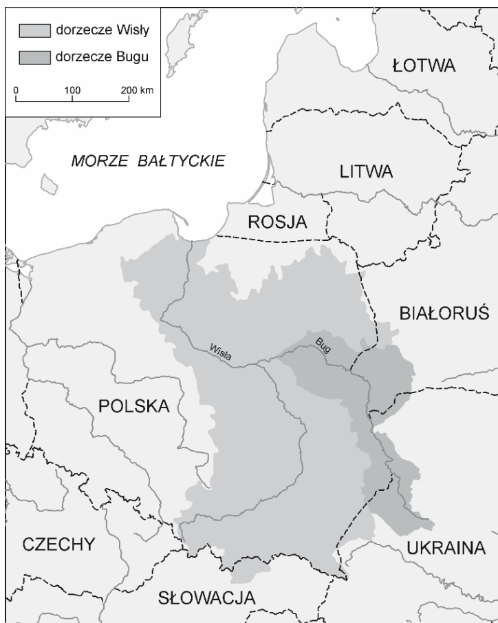
Ryc. 3. Transgraniczny charakter dorzecza Bugu

Rzeka Bug posiada duże potencjalne możliwości do rozwoju i uprawiania turystyki wodnej. Aby tak się stało rzeka powinna być przygotowana infrastrukturalnie do rozwoju tej funkcji m.in. przez: stworzenie stanic wodnych, wypożyczalni sprzętu pływającego, organizacji miejsc noclegowych, zaplecza gastronomicznego itp., a także utrzymywanie jej stanu pozwalającego na odbywanie żeglugi. Dodatkowo atrakcyjność turystyczna Bugu mogłaby być rozwinięta po realizacji programu odtworzenia starych kanałów i połączeniu przez kanał Pojezierza Szackiego z Prypecią oraz utworzeniu przeprawowych przejść granicznych. W tym celu był też realizowany w ramach Programu Współpracy Transgranicznej Polska-Białoruś-Ukraina 2007-2013 projekt Odtworzenie szlaku wodnego E-40 na odcinku Dniepr – Wisła: od strategii do planowania , we współpracy woj. lubelskiego z obwodami brzeskim i wołyńskim. Będzie on kontynuowany w nowej perspektywie finansowej UE 2014-2020.