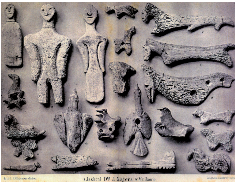
Ryc. 8. Mnikowskie „figliki” wykonane przez robotników Ossowskiego z prehistorycznych kości

Wprawdzie po interwencji Ossowskiego i Majera przyjęcie tego wniosku: „zostało odroczone do ukończenia rozpoczętych już badań w jaskini Wierchowskiej i w Koziałni w dolinie Ojcowskiej”, ale kres programu badań w jaskiniach podkrakowskich stał się faktem.