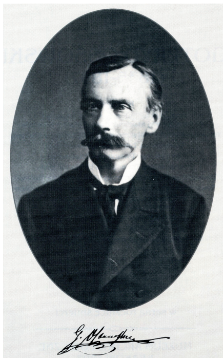
Ryc. 6. Godfryd Ossowski (1835–1897); geolog na Wołyniu, archeolog w Prusach Królewskich i prehistoryk w Krakowie — technik drogowy syberyjskiego traktu pocztowego w Tomsku

prezesa Wydziału Archeologiczno-Historycznego Towarzystwa Naukowego w Toruniu, i otrzymuje propozycję podjęcia działalności badawczej na terenie Prus Królewskich. Po przeniesieniu się w 1874 roku do Torunia, podejmuje poszukiwania archeologiczne i intensywne prace wykopaliskowe, rozkopując wiele obiektów grobowych (zwłaszcza tzw. grobów skrzynkowych z wczesnej