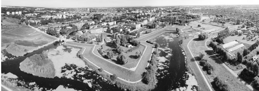
Fot. 1. Widok z lotu ptaka na Dolne Miasto w Gdańsku Źródło: [Urząd Miejski w Gdańsku/micorsystem.com.pl].

[Barański, Chelstowska 2013]. Koncept ten w sposób bezpośredni nawiązuje do założeń programu społecznego „Dolne Miasto Otwarte” [Chelstowska et al. 2010, s. 12-13], którego nazwa została przeniesiona również na program inwestycyjny, a w efekcie na cały program rewitalizacji dzielnicy.