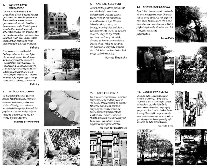
Fot. 3. Fragmenty przewodnika po Dolnym Mieście w Gdańsku wydanego w ramach projektu „Ścieżki żywej pamięci”