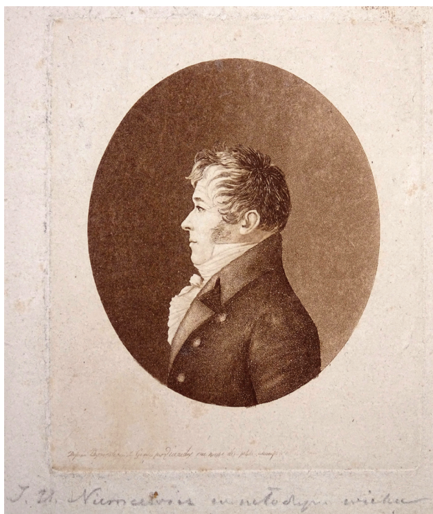
Ryc. 2. Autor nieznany, Julian U. Niemcewicz w młodym wieku, ok. 1800 r., akwatinta.