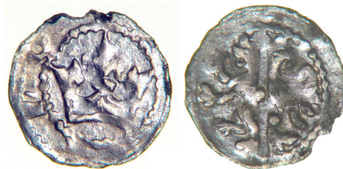
Ryc. 14. Tczyca, pow. miechowski. Denar Władysława Łokietka.

M.: okolica Miechowa. Ok.: prace polowe. D.: przed 2012 r. L.: 1 moneta.