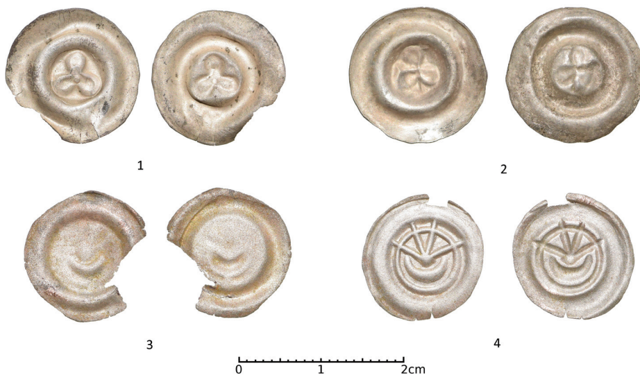
Ryc. 5. Pobiel, pow. górowski. Brakteaty: 1–2, Polska, Śląsk; 3–4, niezidentyfikowane. Skala 1,6:1

D.: 2010 r. L.: cztery monety pojedynczo.