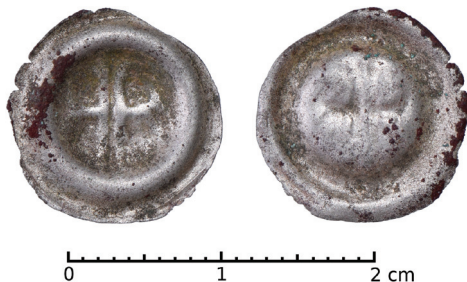
Ryc. 11. Wrocław, ul. Odrzańska 34. Halerz brakteatowy. Skala 2:1

II. M.: ul. Odrzańska 34. D.: 16 września 1998. Ok.: ratownicze badania archeologiczne pod kierownictwem dra Cezarego Buški. K.: zasypisko pieca typu hypocaustum w dawnym domu altarystów. L.: jedna moneta. Zb.: Instytut Archeologii Uniwersytetu Wrocławskiego 14 .