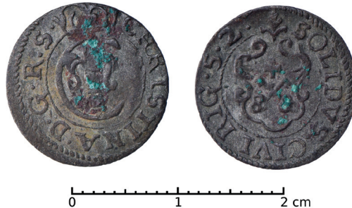
Ryc. 34. Płock, m. pow., okolica. Szeląg ryski. Skala 2:1

D.: przed 2012. Ok.: przypadkowe znalezisko. L.: 1 moneta.