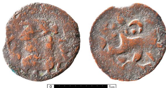
Ryc. 35. Brzeźno, pow. chełmski. Falszywy szeląg Jana Kazimierza.

M.: pola wokół wsi. D.: przed 2016. Ok.: przypadkowe znalezisko. L.: 1 moneta