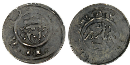
Ryc. 19. Żagań, okolica. Fenig Wertheimu.

M.: okolica miasta. D.: przed wiosną 2015 r. L.: 1 moneta pojedynczo.