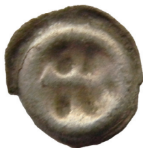
Ryc. 24. Bądkowo. Halerz opolski. Skala 2:1

M.: brak danych. D.: przed lutym 2015 r. L.: 1 moneta pojedynczo.