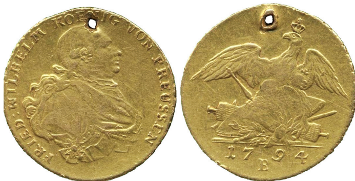
Ryc. 40. Kamień Pomorski. Frydrychsdor. Skala 2:1

M.: ul. Konopnickiej, przy posesji nr 10. D.: 3 X 2014. Ok.: remont chodnika, znalazł Andrzej Włodarczyk. L.: 1 moneta. Zb.: Muzeum Historii Ziemi Kamińskiej.