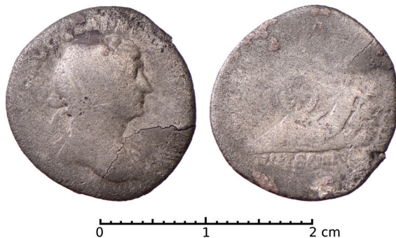
Ryc. 1. Ostrów Wielkopolski. Denar Trajana. Skala 2:1

Rzym, Trajan (98–117), denar 112–114, men. Rzym.