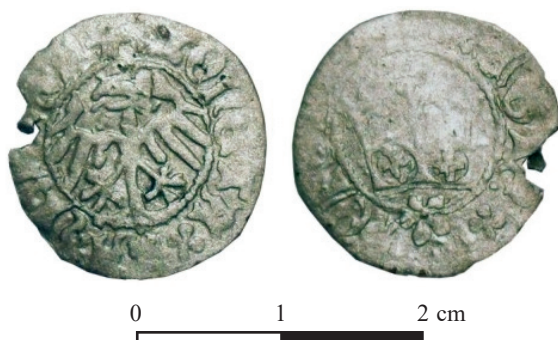
Ryc. 29. Biskupin, pow. żniński. Półgrosz Kazimierza Jagiellończyka. Skala 2:1

Zb.: Muzeum Archeologiczne w Biskupinie.