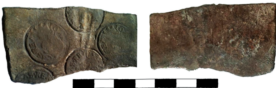
Ryc. 36. Brzezice, pow. świdnicki. Blaszka z odciskami stempla mennicznego.

M.: park podworski, na powierzchni. D.: 8 III 2011. Ok.: prawdopodobnie poszukiwania za pomocą wykrywacza metalu. L.: 1 przedmiot.