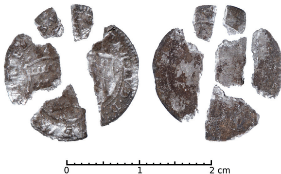
Ryc. 31. Kamienna Góra. Krajcar wirtemberski. Skala 2:1

II. M.: dawne miejsce straceń z relikami murowanej szubienicy położone na pn. stoku Góry Szubianki (dawniej Galgenberg). D.: 20 lipca 2015 r. Ok.: badania archeologiczne prowadzone przez dra Pawła Dumę z Instytutu Archeologii Uniwersytetu Wrocławskiego. K.: moneta została odnaleziona na pograniczu warstwy humusu i warstwy użytkowej dawnego placu straceń. L.: 1 moneta. Zb.: Instytut Archeologii Uniwersytetu Wrocławskiego.