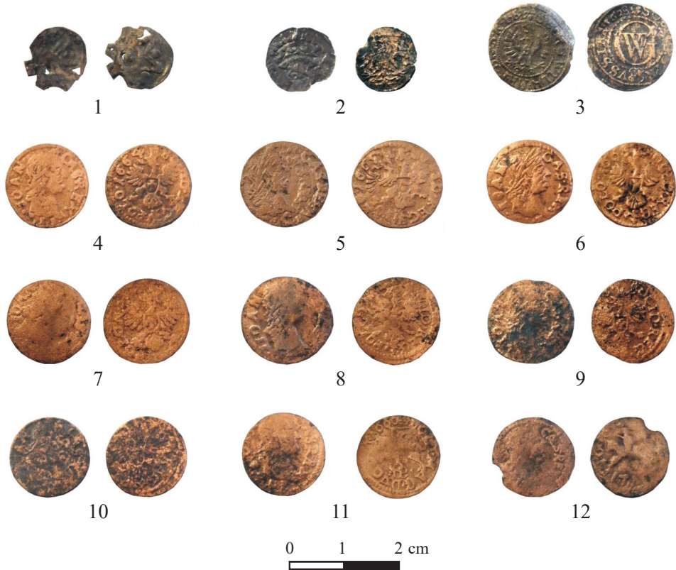
Ryc. 23. Wenecja, pow. żniński. Monety z badań na stanowisku 6

M.: Wenecja, stan. 6 i 7. D.: 2001–2004. Ok.: Badania archeologiczne prowadzone przez Muzeum Archeologiczne w Biskupinie. L.: 13 monet. Zb.: Muzeum Archeologiczne w Biskupinie.