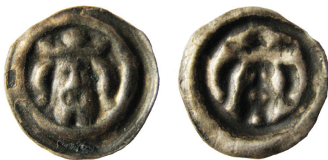
Ryc. 18. Gdańsk. Szwedzki penning brakteatowy. Skala 2:1

II. W połowie 2014 r. pojawiła się na rynku antykwarycznym moneta z wiadomością o znalezieniu w niejasnej przeszłości i okolicznościach w Gdańsku.