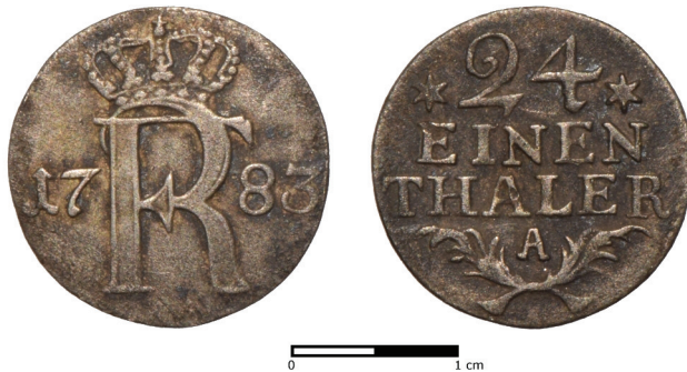
Ryc. 13. Wrocław, ul. Miłoszycka. 1/24 talar (grosz) Fryderyka II z 1783 r. Skala 2:1

Brandenburgia , Fryderyk II, 1/24 talara (grosz) 1783, men. Berlin.