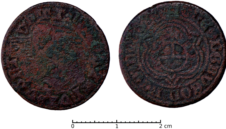
Ryc. 30. Kamienna Góra. Liczman. Skala 2:1

I. M.: okolice miejscowości w kierunku pld. D.: lipiec 2015 r. Ok.: podczas spaceru. K.: liczman zalegał na polu ornym. L.: 1 liczman. Zb.: Instytut Archeologii Uniwersytetu Wrocławskiego.