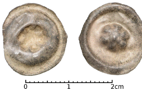
Ryc. 7. Wierzenica, pow. poznański. Brakteat. Skala 2:1

Polska, Śląsk , brakteat guziczkowy, 2. połowa XIII w.