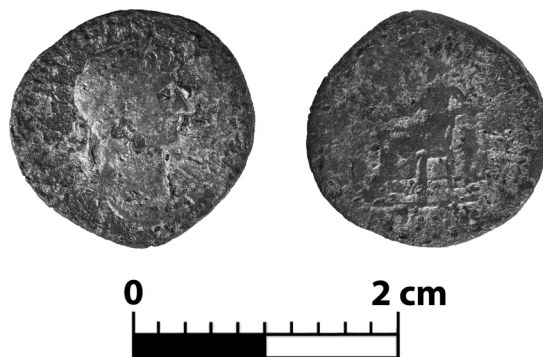
Ryc. 2. Kazimierzów, pow. opolski, woj. lubelskie. Denar Hadriana. Fot. Adam Oleksiak, oprac. G. Śnieżko. Skala: 2:1

archeologicznego Kotliny Chodelskiej” prowadzone były przez dr. Łukasza Miechowicza z ramienia Stowarzyszenia Naukowego Archeologów Polskich, Oddział w Warszawie, i finansowane ze środków Ministra Kultury i Dziedzictwa Narodowego w ramach programu „Dziedzictwo Kulturowe. Ochrona zabytków archeologicznych”. Zb.: Instytut Archeologii i Etnologii PAN w Warszawie.