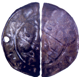
Ryc. 3. Sławsko, pow. sławieński. Moneta lub zawieszka. Bez skali