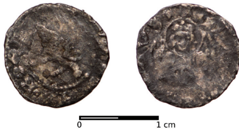
Ryc. 10. Wrocław, ul. Krasieńskiego 1. Parvus Jana Luksemburskiego. Skala 2:1

I. M.: ul. Kraińskiego 1, pd.-wsch. część płyty boiska. D.: 28 IX 2016. Ok.: nadzór archeologiczny prowadzony przez Instytut Archeologii Uniwersytetu Wrocławskiego. L.: 1 moneta. Zb.: Instytut Archeologii Uniwersytetu Archeologicznego.