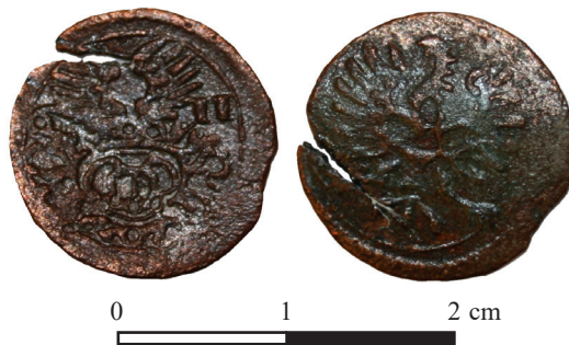
Ryc. 26. Legnica. Dreier karniowski. Skala 2:1

2. Śląsk, Księstwo Karniowskie , Jan Jerzy (1606–1621), dreier (3 halerze) 1611, men. Karniów.