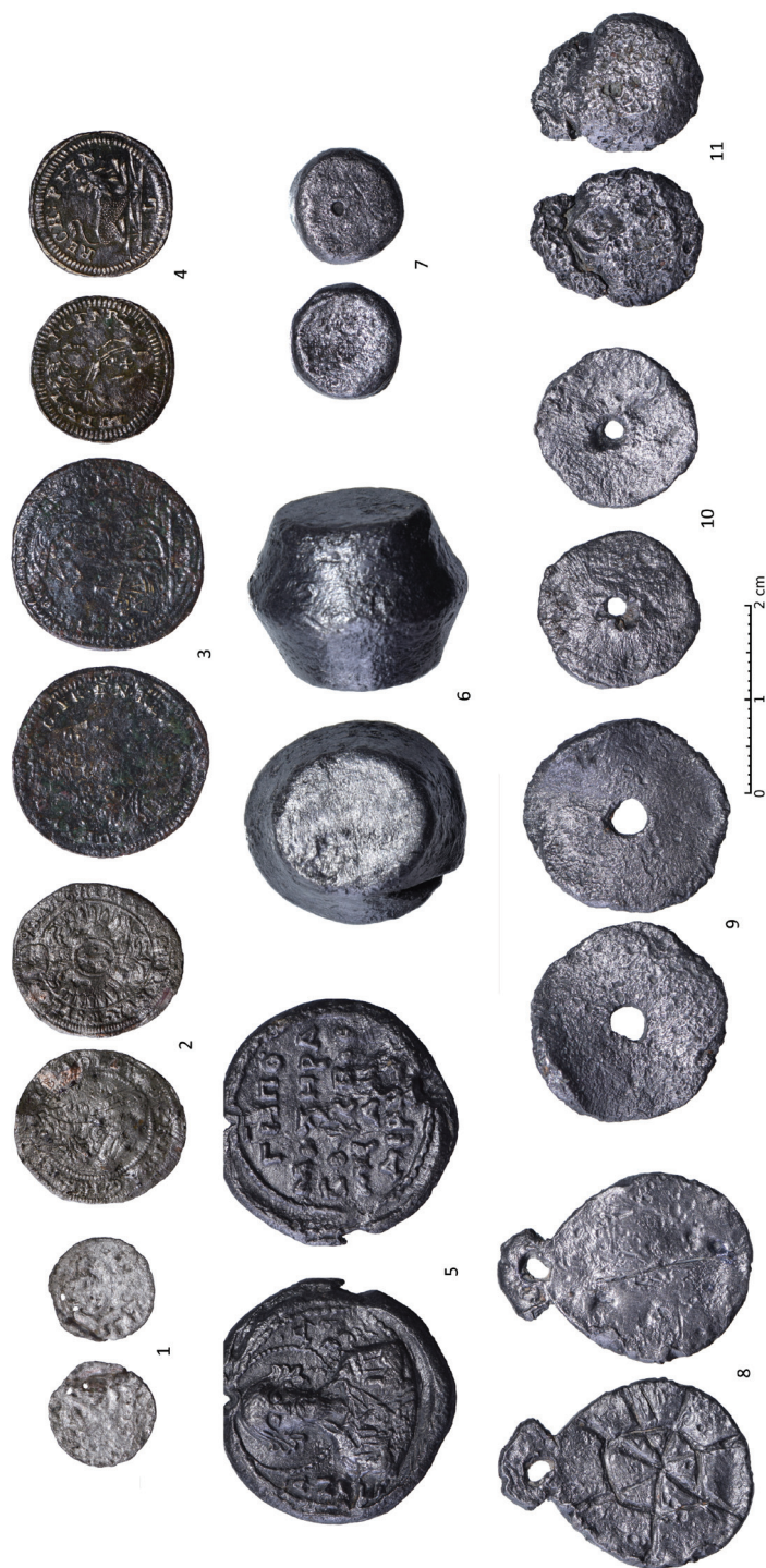
Ryc. 12. Wrocław, ul. Szewska 49. 1 — Śląsk, Legnica, Fryderyk I, halerz 1475-ok. 1485; 2 — Śląsk, Leopold I, krajcar 1698; 3 — Norymberga, Johann Jacob Dietzel, liczman w stylu francuskim; 4 — Norymberga, Johann Jacob Lauer, liczman w stylu francuskim; 5 — Ruś, bulla książęca lub możnowładcza; 6-7 — odważniki; 8-11 — płomby towarowe. Nieznaczone powiększenie.