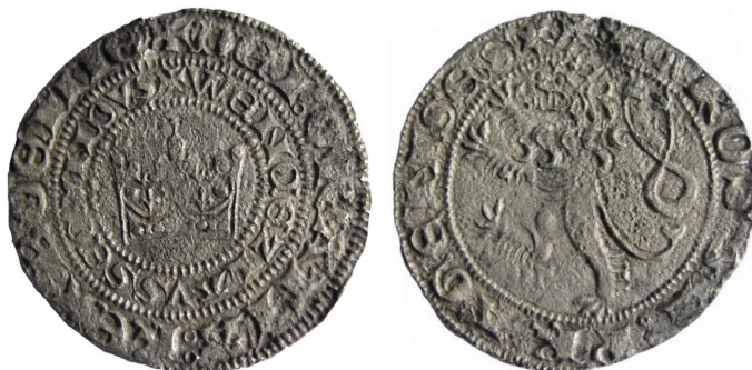
Ryc. 8. Sławno, m. pow. Grosz praski Wacława II. Skala 2:1

M.: między cmentarzem komunalnym a Wieprzą (na północny wschód od miasta lokacyjnego). D.: 2004–2005. Ok.: znalazł ś.p. Michał Krupowies. L.: 1 moneta.