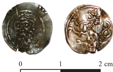
Ryc. 25. Legnica. Halerz wrocławski. Skala 1,8:1

M.: okolica miasta. D.: przed 12 stycznia 2015 r. L.: 3 monety pojedynczo.