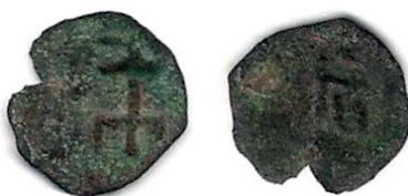
Ryc. 21. Rzeszów. Falszywy denar Władysława Jagiełły. Skala 2:1

M.: kamienica, prawdopodobnie przy ul. Baldachówka. D.: jesień 2014 r. Ok.: prace remontowe. L.: skarb złożony z 23 monet. Tpq.: 1396.