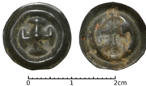
Ryc. 6. Warzymowo, pow. koniński. Brakteat. Skala 2:1

Nieokreślony brakteat guziczkowy, 2. połowa XIII–1. połowa XIV w. (?).