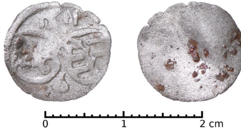
Ryc. 32. Złotoryja, m. pow. Fenig saski. Skala 2:1

M.: stanowisko na Górze Mieszcząńskiej (dawniej Galgenberg , później Bürgerberg ), dawna szubienica. D.: 20 lipca 2016 r. Ok.: badania archeologiczne prowadzone przez dra Pawła Dumę z Instytutu Archeologii Uniwersytetu Wrocławskiego. K.: moneta została odnaleziona w warstwie kulturowej we wnętrzu murowanej szubienicy. L.: 1 moneta. Zb.: Instytut Archeologii Uniwersytetu Wrocławskiego.