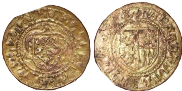
Ryc. 17. Gdańsk. Liczman. Skala 2:1

3. Norymberga (?), liczman anonimowy, 2. połowa XV w.