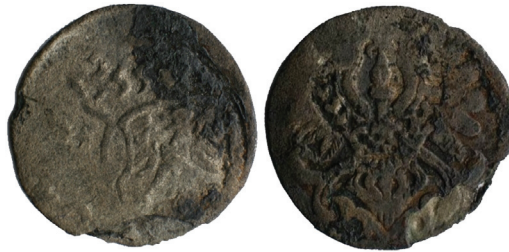
Ryc. 33. Radłów, pow. oleski. Dreier brandenburski. Skala 2:1

M.: AZP 84-43 nr 11, Radłów, stanowisko 8, grób szkieletowy nr 32. D.: 1982–85. Ok.: Badania archeologiczne prowadzone przez Wojciecha Łonaka. K.: w obrębie jamy ustnej szkieletu. L.: 1 moneta pojedynczo. Zb.: Muzeum Regionalne w Oleśnie.