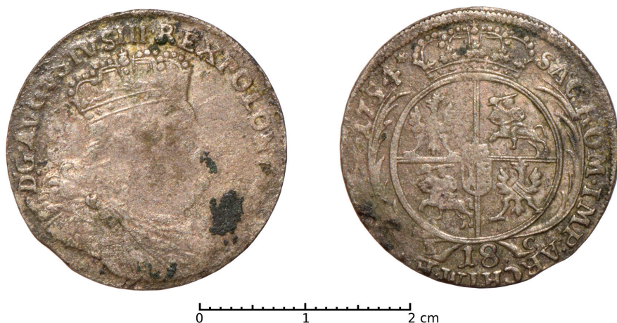
Ryc. 39. Leszno, pow. grodzki. Ort koronny Augusta III. Fot. Ł. Sroka. Skala 2:1

M.: Okolice lotniska w Lesznie-Strzyżewicach. D.: ok. 2000 roku. Ok.: znalezi-sko przypadkowe.