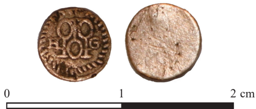
Ryc. 27. Legnica. Żeton anonimowy. Fot. anonimowa. Skala 3:1

Miedź lub bilon, 0,5 g, 16,5 mm. Fbg.Seg. 3353, Saurma 386/163 (ryc. 26).