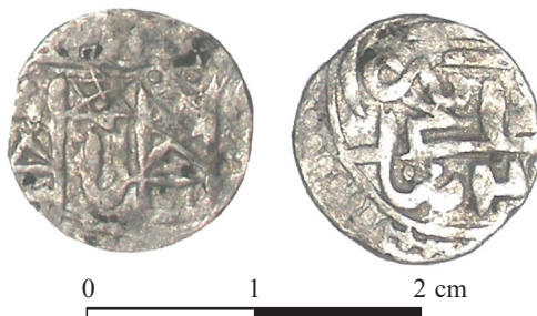
Ryc. 20. Janów, pow. chełmski. Naśladownictwo dirhema. Skala 2:1

M.: nieznane. D.: przed marcem 2012 r. L.: 1 moneta pojedynczo.