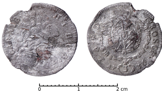
Ryc. 38. Kościan. 3 krajcary bawarskie. Skala 2:1

D.: przed 2013. Ok.: przypadkowe znalezisko. L.: jedna moneta.