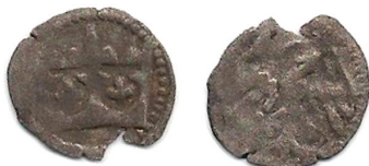
Ryc. 22. Rzeszów. Denar Władysława Jagiełły. Skala 2:1

Miedź, 0,21 g, 11,5 mm, ilość: 5 sztuk (ryc. 21).