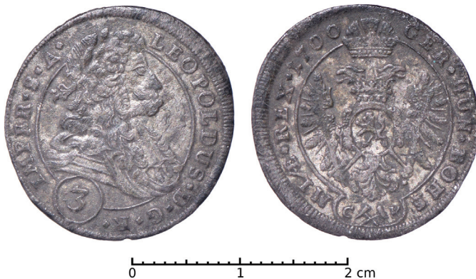
Ryc. 37. Strzyżewice, pow. leszczyński. 3 krajcary czeskie. Skala 2:1

M.: pole orne na południe od Strzyżewic. D.: przed 2009. Ok.: przypadkowe znalezisko. L.: dwie monety osobno.