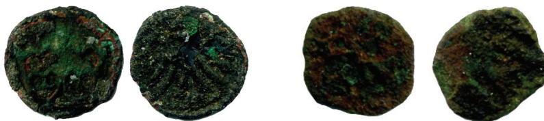
Ryc. 28. Sternalice, pow. oleski. Denary Władysława Warneńczyka. Fot. W. Łonak. Skala 2:1

2. Polska , Władysław Warneńczyk (1434-1444), denar.