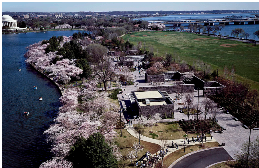
Fot. 2. Franklin Delano Roosevelt Memorial

Jest to drugi tak znaczący pomnik wśród innych Mall (fot. 2). Projektant, Lawrence Halprin, został wybrany do tego zadania w 1974 r. Głównym tematem jest woda, ma ona zadanie symboliczne i praktyczne. Roosevelt kochał wodę, żeglowanie po morzu, stała się ona też poniekąd przyczyną jego