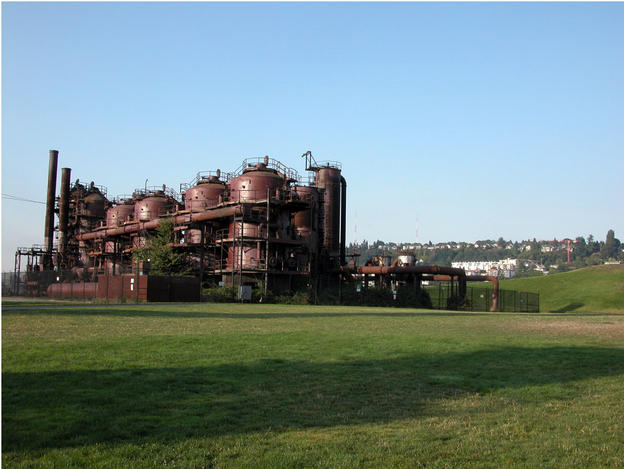
Fot. 4. Gas Work Park