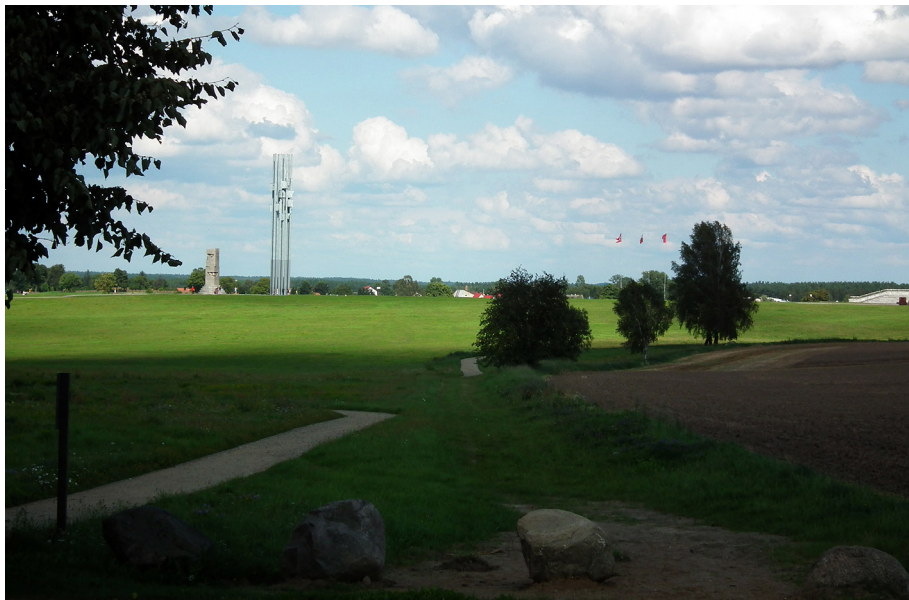
Fot. 7. Pola Grunwaldzkie

Jest to pomnik historii – podlega zatem ochronie ze względu na szczególne wartości historyczne, przestrzenne, materialne i niematerialne (fot. 7). Zwycięstwo wojsk Jagielly nad zakonem krzyżackim stało się symbolem i wartością narodową niezwykle trwale zapisaną w świadomości Polaków. Co roku gmina, Związek Harcerstwa Polskiego, „Wspólnota Drużyn Grunwaldzkich” i bractwa rycerskie 15 lipca organizują Dni Grunwaldu. Przy pomniku odbywają się uroczystości, jednak największą atrakcją jest inscenizacja bitwy, w której udział biorą bractwa rycerskie z Polski oraz zagranicy. Pamięć zostaje pobudzona do życia.