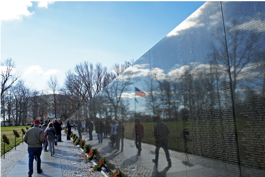
Fot. 1. Vietnam Veterans Memorial

Vietnam Veterans Memorial jest przykładem bardzo spójnej i prostej struktury, która odbija się w interpretacji porządku, rzeczy i charakteru. Czas jest tutaj symbolem upamiętnienia, a światło tworzy grę z widzem poprzez