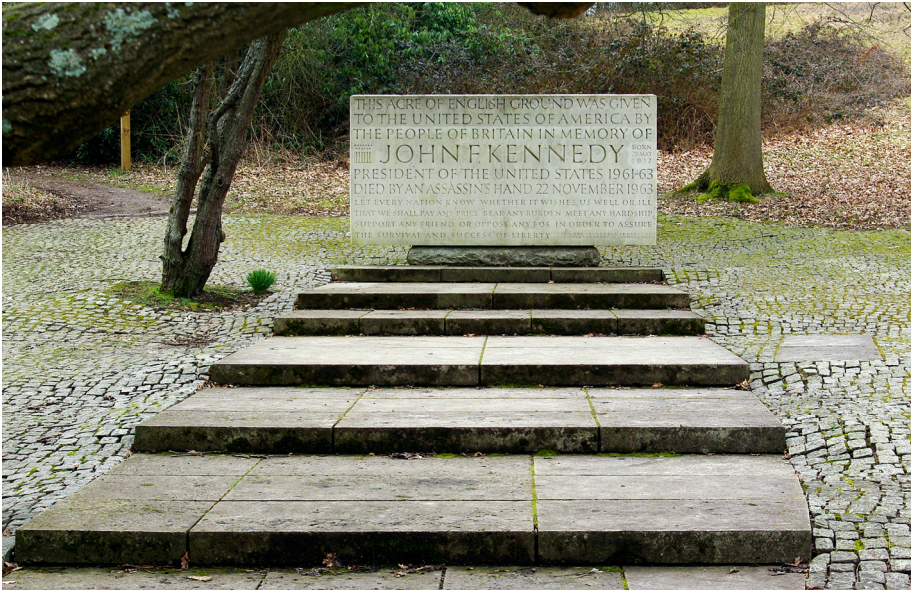
Fot. 3. Kennedy Memorial