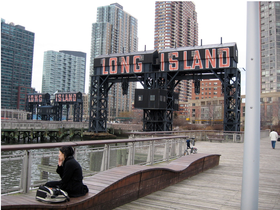
Fot. 5. Gantry Plaza State Park