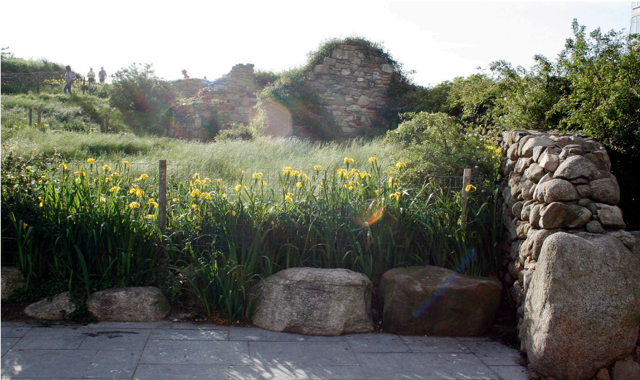
Fot. 6. Irish Hunger Memorial