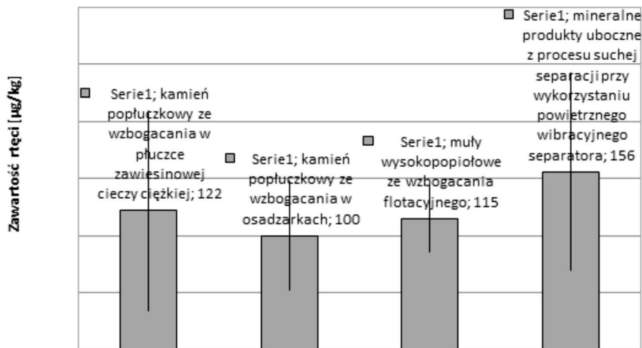
Rys. 1. Średnia zawartość rtęci w mineralnych produktach ubocznych z procesu wzbogacania węgla kamiennego (odchylenie standardowe przedstawione w postaci wąsów)

Należy stwierdzić, że w świetle obowiązujących przepisów prawnych zawartość rtęci w odpadach górniczych z procesu wzbogacania na mokro i suchej separacji nie limituje ich wykorzystania. Dla przykładu podana w rozporządzeniu Ministra Środowiska (Rozporzą-