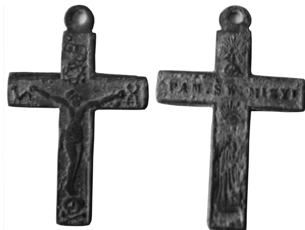
Ryc. 4. Krzyżyk z brązu z legendą PAM ŚW. MISYI, XIX w.