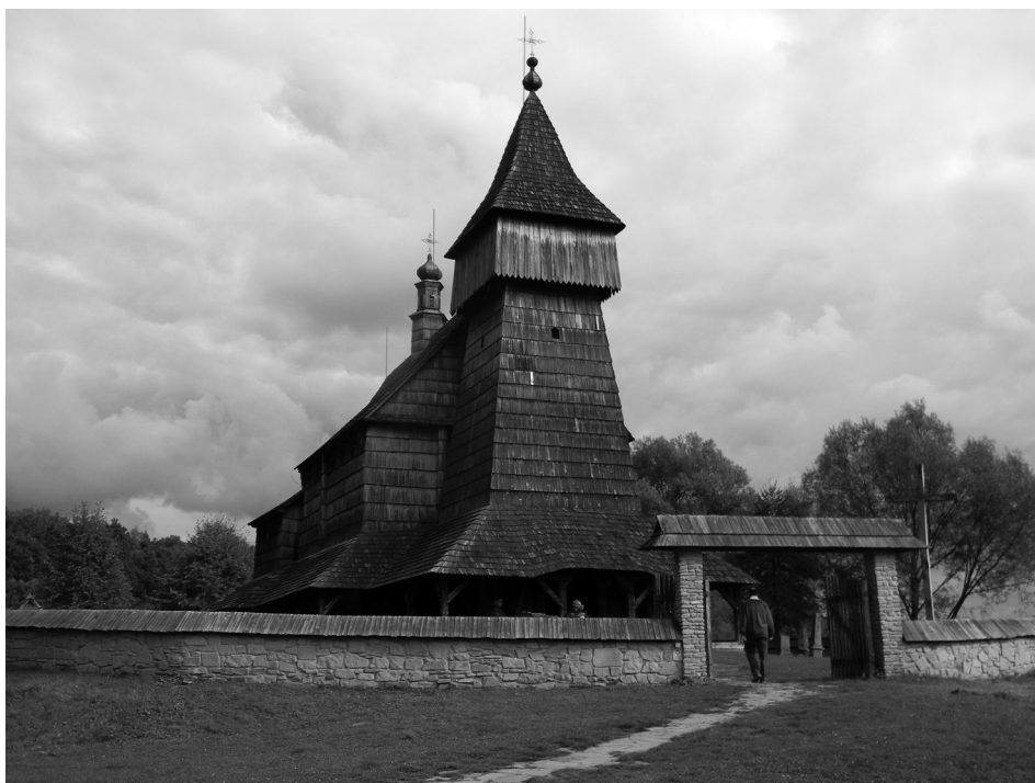
Ryc. 2. Kościół z Bączala Dolnego po rekonstrukcji w Muzeum Budownictwa Ludowego w Sanoku.