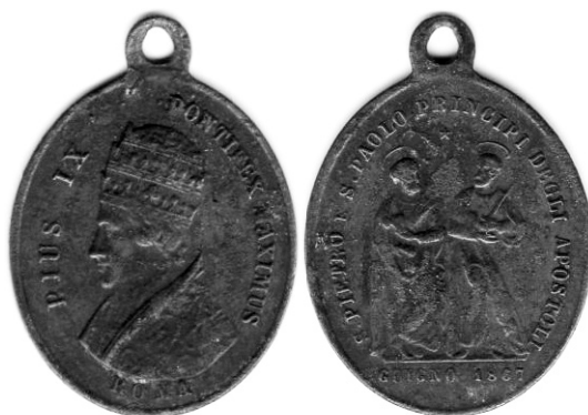
Ryc. 5. Medalik religijny, Rzym, 1867. Legendy: Av. PIUS IX PONTIFEX MAXIMUS / ROMA, Rv. S.PIETRO E S.PAOLO PRINCIPI DEGLI APOSTOLI / GUIGNO [sic] 1867

(a więc z lat ok. 1470–1480) opisuje należności i opłaty określone w pieniądzu. Wydaje się więc mało prawdopodobne, aby żadna ze starszych drobnych emisji o niskiej wartości (przynajmniej szelągowe i kwartnikowe z 1. połowy XVII w., czy też denary tzw. jagiellońskie z XV w.) nie została tu nigdy zagubiona — nawet biorąc pod uwagę prymitywny sposób przeszukania terenu. Stąd wątpliwość, czy nowy budynek rzeczywiście powstał w latach 1666–1667 dokładnie w tym samym miejscu, gdzie rozebrano stary.