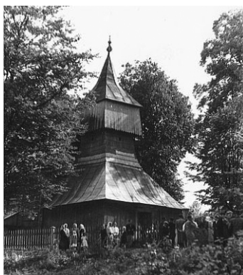
Ryc. 1. Kościół w Bączalu Dolnym, lata 30. XX w.

ABSTRACT: In 1972 a seventeenth century wooden church has been moved from Bączal Dolny to an open-air museum. Over 30 coins dating back to a period ranging between the middle seventeenth century and the middle twentieth century have been found in thxe place where the church used to be located. Lack of older coins proves that if there was another church in this area before the 1600s, it could not have been erected on the same spot.