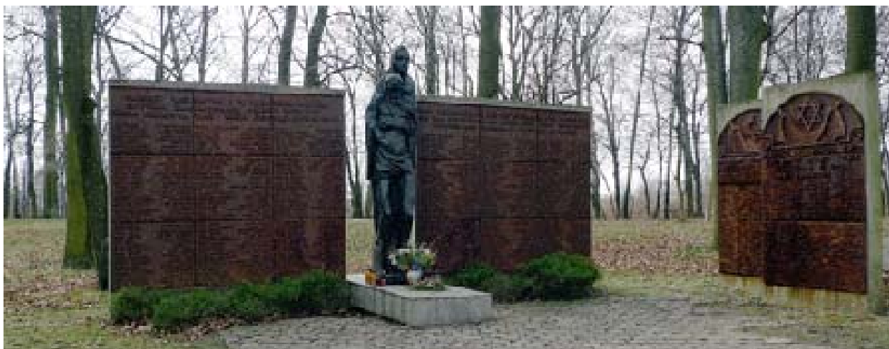
Il. 2. Pomnik pomordowanych pacjentów szpitala psychiatrycznego w Krakowie-Kobierzynie, autorstwa prof. Józefa Sekowskiego.

Można powiedzieć, że ten monumentalny głaz z inskrypcją posadowiony na trójstopniowym postumencie z łamanego kamienia obrazuje podejście estetyczne tamtego czasu do problematyki tworzenia miejsca pamięci w krajobrazie. Symboliczne zastosowanie kamienia jako materiału trwałego i szlachetnego idzie w parze z wyeksponowaniem obiektu jako akcentu w całej kompozycji. Szerokość