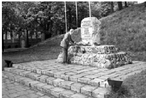
Il. 1. Pomnik w Obrzycach (dawny zakład Meseritz-Obrawalde).

W Polsce pierwsze sposoby upamiętniania podjęto w latach bezpośrednio powojennych – jak na przykład wmurowanie tablicy w budynku dyrekcji