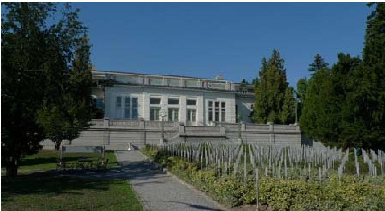
Il. 10. Pomnik ofiar placówki Am Spiegelgrund przed budynkiem teatru szpitala Am Steinhof w Wiedniu (proj. Tanja Walter).

Ill. 10. Memorial of the victims Am Spiegelgrund institution in front of the theatre at the hospital Am Steinhof in Vienna designed by Tanja Walter.