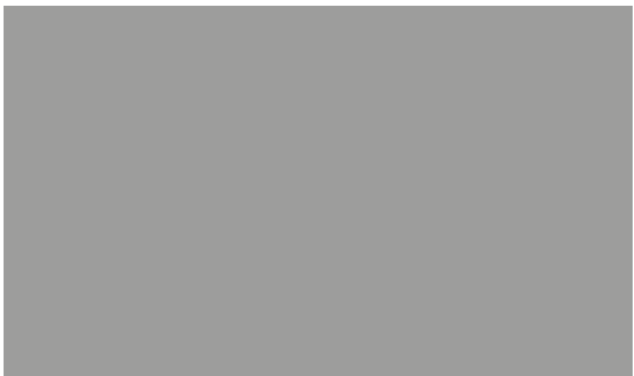
Il. 8. Pomnik ofiar eutanazji w Berlinie-Buch w zespole Campus C.W. Hufeland (proj. Patricia Pisani).

Ill. 7. Opening of the installation commemorating children victims of Wiesloch designed by Elke Weickelt-Starzinski in 2015.