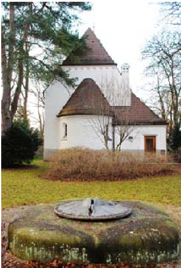
Il. 3. Pomnik ofiar akcji T4 w dawnym szpitalu Eglfing-Haar, proj. Josef Gollwitzer.