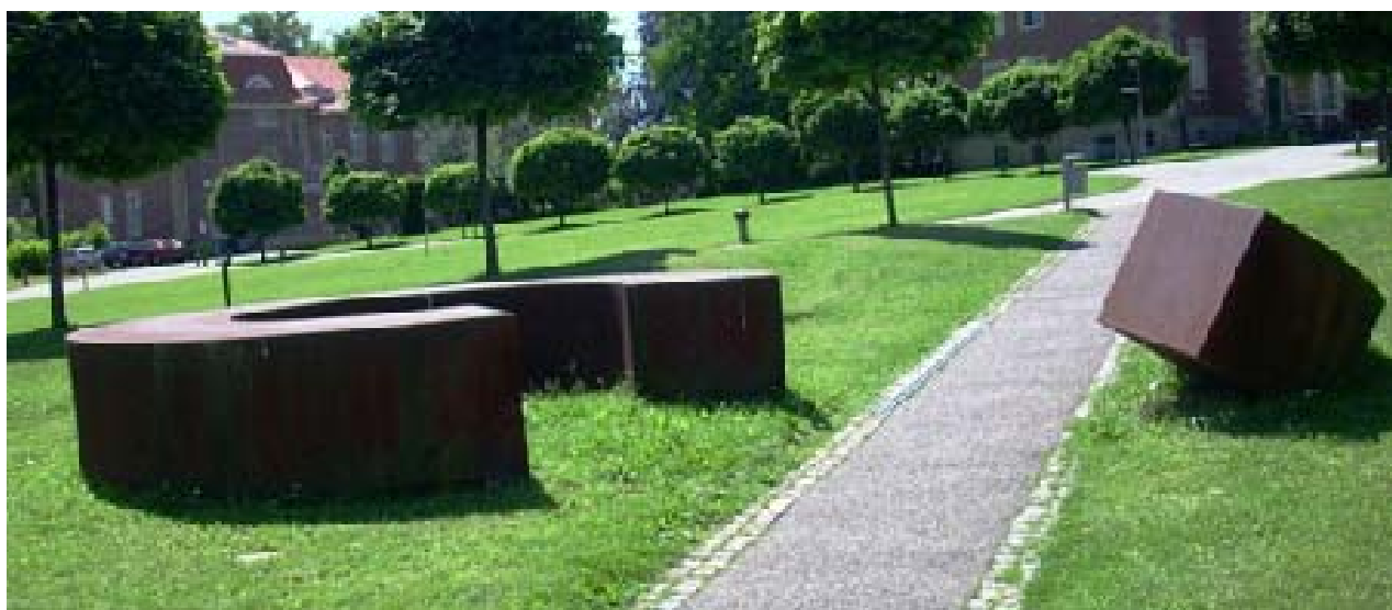
Il. 6. Pomnik w Psychiatrisches Zentrum Nordbaden w Wiesloch (proj. Susanne Zetzmann).

Ill. 5. Memorial of the nazi euthanasia victims in Bezirkskrankenhaus Ansbach designed by Meike Büdel