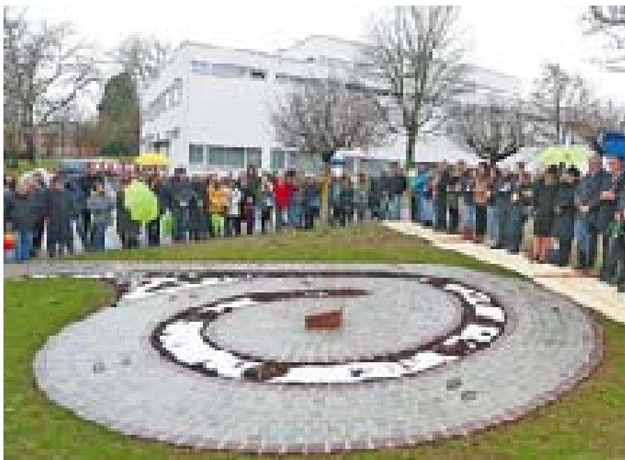
Il. 7. Odślonięcie instalacji poświęconej pamięci ofiar-dzieci w Wiesloch (proj. Elke Weickelt-Starzinski, 2015 rok), Źródło: Rhein-Neckar-Zeitung, Fot. Pfeifer

Ill. 7. Opening of the installation commemorating children victims of Wiesloch designed by Elke Weickelt-Starzinski in 2015. Source: Rhein-Neckar-Zeitung, Photo: Pfeifer