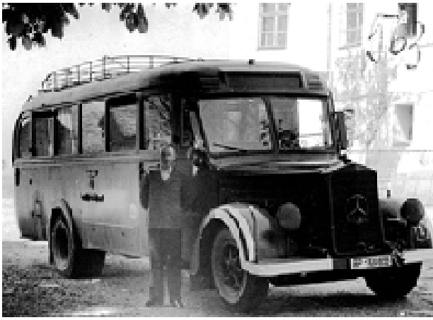
Il. 9. Szary autobus – furgonetka, którą transportowano chorych do miejsc zagłady, Źródło: archiwum Dokumentationsstelle Hartheim, domena publiczna