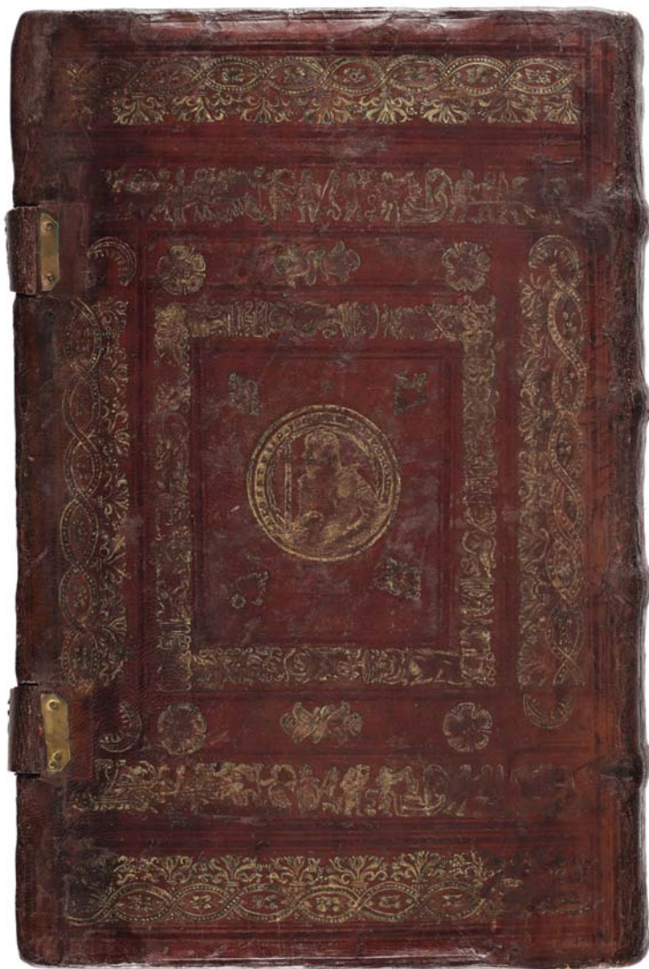
Il. 3b. Oprawa Kaspara Anglera (dolna okładzina) z supereklibrisem dedykacyjnym i portretowym medalionem (w funkcji własnościowej) księcia Albrechta Pruskiego, Królewiec, 1554; zbiory Biblioteki Uniwersyteckiej w Toruniu.