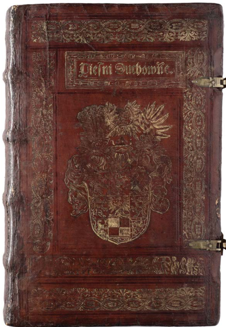
Il. 3a. Oprawa Kaspara Anglera (górna okładzina) z supereklibrisem dedykacyjnym i portretowym medalionem (w funkcji własnościowej) księcia Albrechta Pruskiego, Królewiec, 1554; zbiory Biblioteki Uniwersyteckiej w Toruniu.