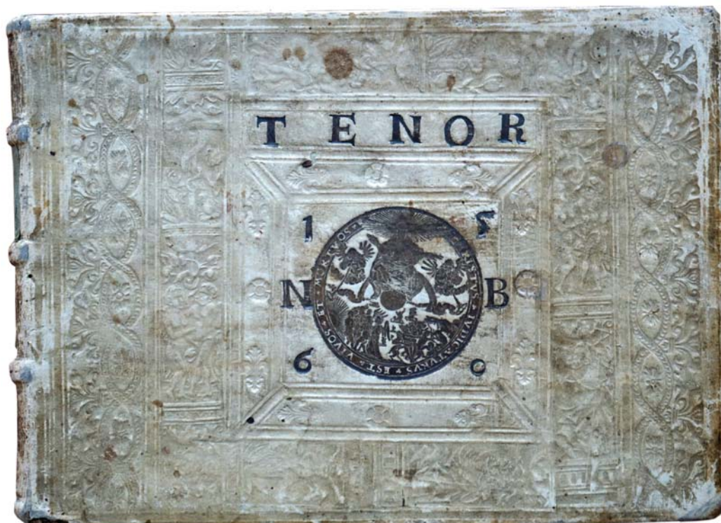
Il. 4. Oprawa Kaspra Anglera (górna okładzina) z medalionem ukazującym Sąd Ostateczny, Królewiec, 1560; zbiory Wojewódzkiej Biblioteki Publicznej – Książnicy Kopernikańskiej w Toruniu.