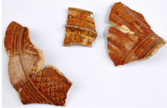
Ryc. 3. Fragmenty naczyń znalezione w miejscu odkrycia skarbu Rokitno II