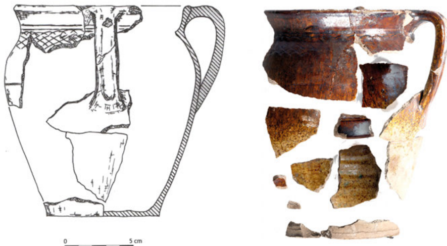
Ryc. 1. Naczynie ze skarbu monet Rokitno I. rys. J.M. Michalak-Ścibior