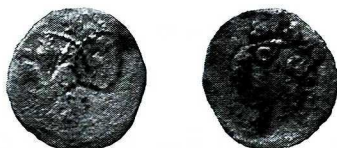
Ryc. 3. Stare Kolnie, gm. Popielów, pow. opolski. Kwartnik śląski, dominium nyskie, 1. ćwierć XIV w.

Srebro, wżery korozyjne, 1,14 g, 18,3 mm. Friedensburg 1887–1888, poz. 762; Friedensburg 1931, poz. 430. Nr inw. M2, wykop B, głęb. 60, 25 IX 2010.