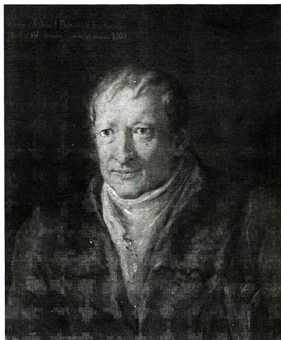
Ryc. 1. Jerzy Samuel Bandtkie. Portret w Muzeum Uniwersytetu Jagiellońskiego.

kuł o najdawniejszych monetach polskich i śląskich, który następnie, w 1816 roku, ukazał się w wersji polskiej 9 przetłumaczony przez jego brata Jana Wincentego Bandtkiego, znanego historyka prawa, profesora Uniwersytetu Warszawskiego 10 . Praca ta, bazująca wyłącznie na informacjach dostarczonych przez źródła pisane i wykorzystująca ustalenia Naruszewicza oraz badaczy czeskich, próbowała wyjaśnić małą ilość monet śląskich z okresu przed XIII w. praktyką ich przetapiania. Jednocześnie Bandtkie wysuwa tezę, że na Wschodzie Europy monetę metalową zastępowały futra. Celem tego artykułu, jak podkreślał autor, było wykazanie błędności pewnych przesądów, które „powzięte zostały przeciwko Czechom i Polsce” przez badaczy niemieckich 11 . Bandtkie wydał też w r. 1806 niemiecką wersję opracowaną przez Tadeusza Czackiego Tabeli ewaluacji monet polskich i litewskich 12 , zaopatrując ją w dedykację oraz Nachtrag 13 .