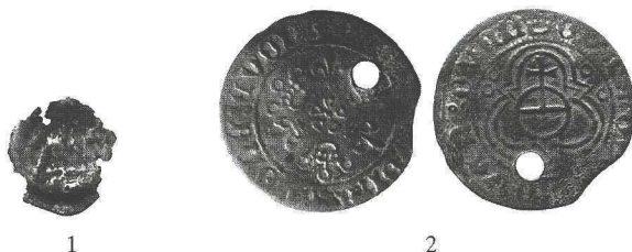
Ryc. 3. Pień. Halerz brakteatowy Bolesława IV. Liczman norymberski. Skala 1:1

miedz, w. 1,65 g, \varnothing 24 mm, w górnej prawej części od strony aw. otwór o \varnothing 3 mm Neumann nr 32472-73 odm.