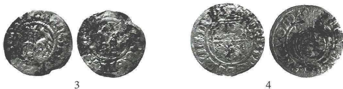
Ryc. 4. Pień. Półgrosz Jana Olbrachta. Półtorak Zygmunta III. Skala 1:1

Polska , Jan Olbracht (1492–1501), półgrosz koronny, 1492-ok. 1498, men. Kraków srebro, w. 0,53 g, \varnothing 18 mm Str. tabl. XXXIV/c; Kub. II typ I, aw. 2, rw. 1