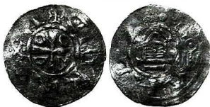
Ryc. 11. Zagórzyn. Denar Ottona i Adelajdy. Skala 1:1

Saksonia? Denar Ottona i Adelajdy lub jego naśladownictwo, w. 1,45 g, ø 19 mm, Hatz III.7a (983/4 – ok. 995) 1 . Av. Krzyż równoramienny z OODD między ramionami, obwódka ciągła, pomyłona legenda +DIIGR[ARE]XA, Rv. Kapliczka z krzyżem na zwieńczeniu, obwódka ciągła, legenda TΘΘAHL[AT]