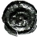
Ryc. 8. Wleń. Brakteat (moneta nr 1). Skala 1:1

Moneta uszkodzona, wyszczerbiona, nieczytelna.