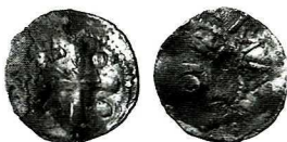
Ryc. 10. Łekno. Denar Ottona III. Skala 1:1

Frankonia , men. Wormacja, denar z czasów Ottona III (983–1002), w. 0,94 g, ø 16 mm, Dbg 844a; DMG 34, Salmo 76:45. Av. Krzyż równoramienny z punktami i pastorałem pomiędzy ramionami, obwódka perełkowa, legenda nieczytelna, Rv. Kapliczka z krzyżem na zwieńczeniu i kółkiem w środku, obwódka perełkowa, legenda [VVOR]MA[TIA]