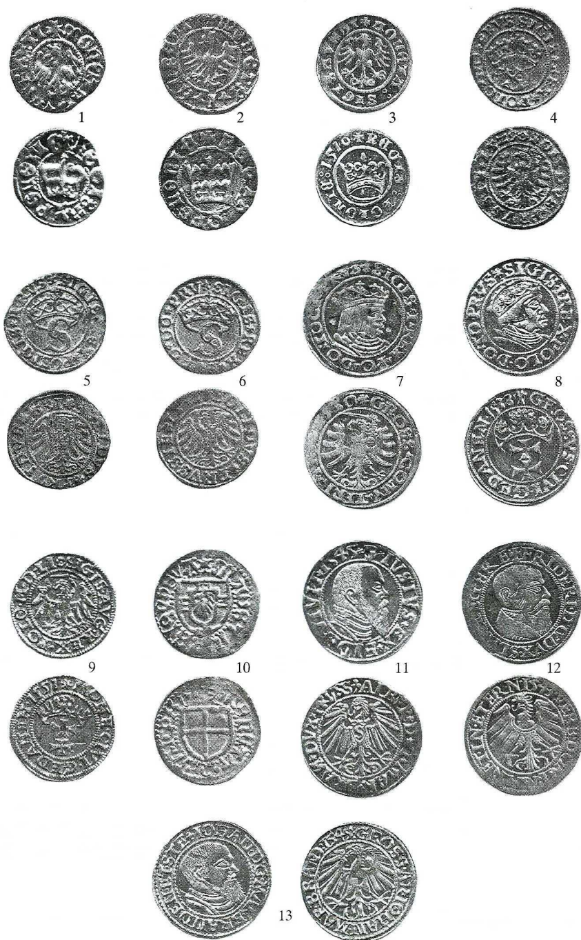
Tablica I. Monety ze skarbu z Dobrzyń. 1. Jan Olbracht, półgrosz kor., Cz. 194; 0,852 g; 2. Jan Olbracht, półgrosz kor., Cz. 196; 0,999 g; 3. Zygmunt I, półgrosz kor., 1510 r., Cz. 226; 0,984 g; 4. Zygmunt I, szeląg ziem pr., 1529 r., Cz. jak 298; 1,094 g; 5. Zygmunt I, szeląg ziem pr., 1531 r., Cz. jak 308; 1,065 g; 6. Zygmunt I, szeląg ziem pr., 1531 r., Cz. 4846; 1,084 g; 7. Zygmunt I, grosz ziem pr., 1530 r., Cz. 4839; 2,025 g; 8. Zygmunt I, grosz gd., 1538 r., Cz. 385; 1,903 g; 9. Zygmunt August, szeląg gd., 1551 r., Cz. 473; 1,118 g; 10. Henryk Reffle von Richtenberg, szeląg, Bft 808; 1,086 g; 11. Albrecht Hohenzollern, grosz, 1545 r., Bft 1196; 1,964 g; 12. Fryderyk II, grosz, 1543 r., Bft 1258; 1,883 g; 13. Jan Kostrzyński, grosz, 1545 r., Bft 1244; 1,910 g. Skala 1:1