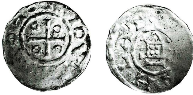
Abb. 4. Bolesław Chrobry (Such. 3), jetzt in der Sammlung des Königlichen Schlosses in Warschau. Maßstab 2:1

Für die Datierung der Typen ist die Datierung der Vorbilder wichtig. Da der Typ I der Otto-Adelheid-Pfennige mit Kopf erst um 995 entstanden ist, könnten die polnischen Nachahmungen (Such. 4–7) nicht früher als in den letzten Jahren des 10. Jahrhunderts geprägt worden sein, wahrscheinlich erst um 1000. Etwas früher könnten die Nachahmungen des Typs III mit „Holzkirche“ sein (Such. 3, 3/4, 3a — aus Ulejno), was wir auch schon aus der Abfolge der Stempelverbindungen gesehen haben. Diese Verbindungen weisen darauf, dass in Polen beide Typen (III und IV) weiter gemeinsam geprägt wurden. Als Muster für polnische Nachahmungen sehe ich eher die Variante Hatz III,4 als Hatz III,3 (hier sind die Punkte im Kreuz geordnet und nicht im Viereck). Es ist jedoch wahr, dass auch die Variante Hatz III,4 nicht ganz deutlich den polnischen Imitationen entspricht (hier 4 und nicht 5 Punkte).