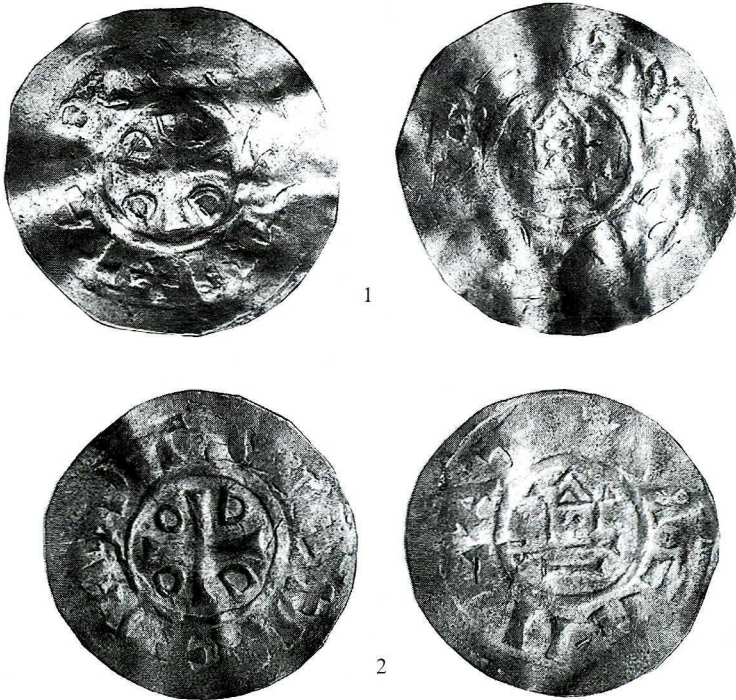
Abb. 1 und 2. Bolesław Chrobry, neue polnische Otto–Adelheid–Pfennige aus dem Fund von Ulejno (Westfälisches Landesmuseum, Münster). Fot. P. Ilisch. Maßstab 2:1

Die Fundstücke wiegen 1.37 und 0.93 g. Die Durchmesser betragen 22 bzw. 19,5 mm. Der Aussenrand des Stempels ist beidseitig schlicht und ohne Gestaltung, während die frühen Original–Otto–Adelheid–Pfennige hier meist eine Zackung aufweisen, die auch bei den Stempel mit Kopf des Boleslaw kopiert worden ist. Die Legende ist kaum in typographisch druckbare Lettern übersetzbar, ist aber von dem üblichen DI GRA REX weiter entfernt als der Durchschnitt.