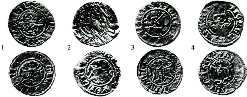
Ryc. 5. Żerniki. Kwartniki Kazimierza Wielkiego. Skala 1:1.

II. M.: stanowisko 25, wypełnisko chaty (nr 2) i wtórne złożo (nr 1). D., Ok. jw. L.: 2 monety luzem. Zbiór: jw.