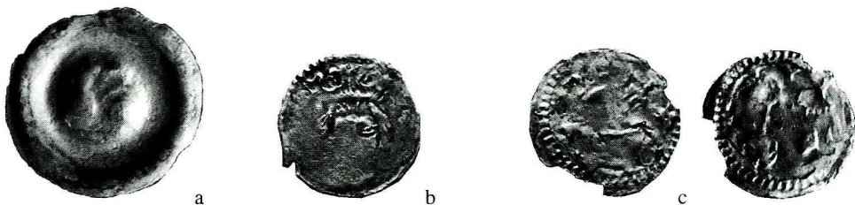
Ryc. 2. Wielowieś. Monety nr 1–3. Skala 1,5:1.

Kom.: Wszystkie monety wykazują dużą zawartość srebra i śladową innych metali poza miedzią. Analogie ma jedynie anonimowy brakteat z głową orła, bity zapewne w Polsce lub na Śląsku (podobny: Fbg 832). Można znaleźć zbliżone do niego rysunkiem denary ze skarbu z Przyłęku 3 .