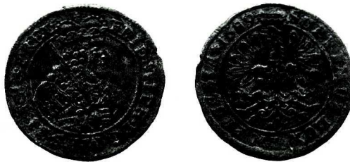
Ryc 7. Blizanów. Fałszywy ort Fryderyka Wilhelma. Skala 1:1.

Kom.: Nie notowana dotąd odmiana orta pruskiego z roku 1689, zbliżona do nr. 1739 wg Schröttera, ale na rewersie litery AB (zamiast HS). Egzemplarz ten wybity jest poprawnie, jednak mylna data i słaba jakość kruszcu mogą wskazywać na fałszerstwo.