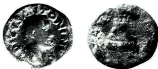
Ryc. 1. Chabielice. Denar Marka Aureliusza. Skala 1:1.