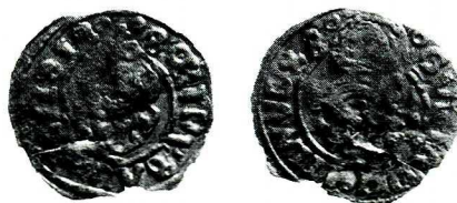
Ryc. 6. Radom. Fałszywy szeląg ryski. Skala 1,5:1. Fot. W. Pohorecki.

Ryga , Gustaw II Adolf (1621–1632), szeląg fałszywy; Av. nieczytelny inicjał (S?) pod koroną, z boków może jakieś znaki, korona poza obwódka, w otoku °GV[S]TA DO(?)IIAVS×8°; Rv. kartusz z zatartym herbem Rygi, w otoku °SOLIDVSA:IZ \ IISI[S]?°; b. cienki, nieregularny krążek miedziany, bez jakichkolwiek śladów bielenia; ubytki części przykrawędnych oraz spęknięcia przechodzące poprzez otok ku środkowi; przed odczyszczeniem 0,274 g (obecnie 0,229 g), 16,0 mm.