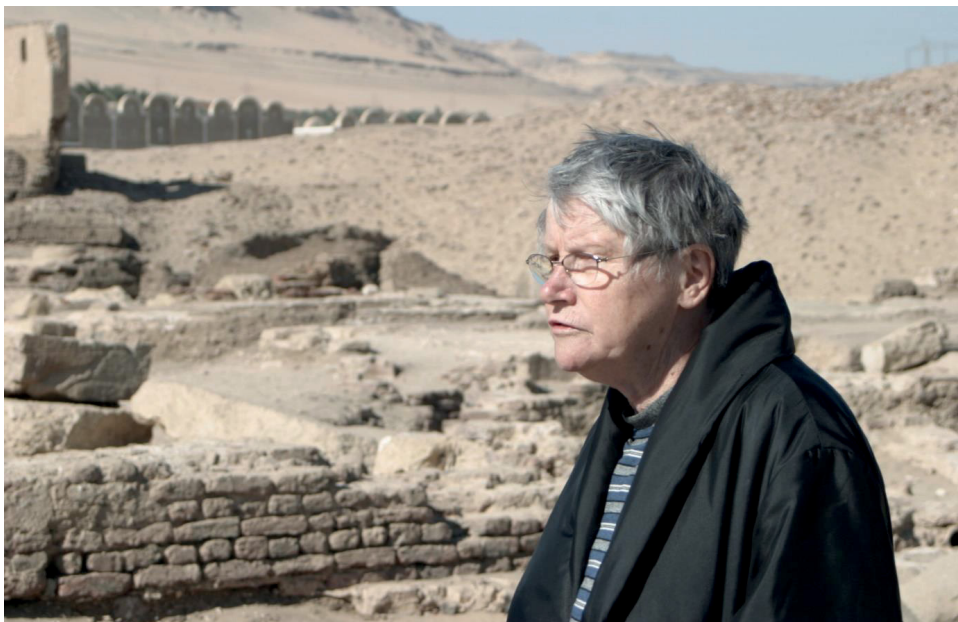
W ruinach klasztoru Szenutego w Sohag w Górnym Egipcie. Luty 2006 r.

Byłam przerażona. Na początku starałam się szukać wśród księży konsultantów, bez skutku. Mam na myśli polskich księży, bo tylko z nimi w tym czasie miałam kontakt. Ale pojawiła się trzecia grupa źródeł. Poza papirusami i tekstami literackimi – archeologia.