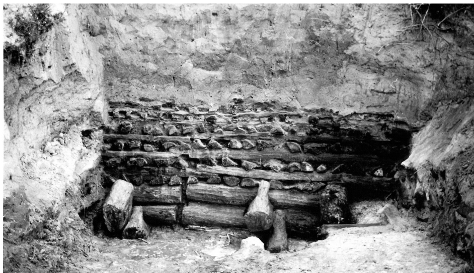
Il. 3. Bnin – grodzisko wczesnośredniowieczne; dolne partie konstrukcji dębowych wału obronnego.

się dachy. Zabudowę uzupełniały urządzenia gospodarcze, zapewniające samowystarczającą egzystencję mieszkańcom tej osady, opartą na uprawie roli i chowie zwierząt, uzupełnianym łowiectwem i rybołówstwem.