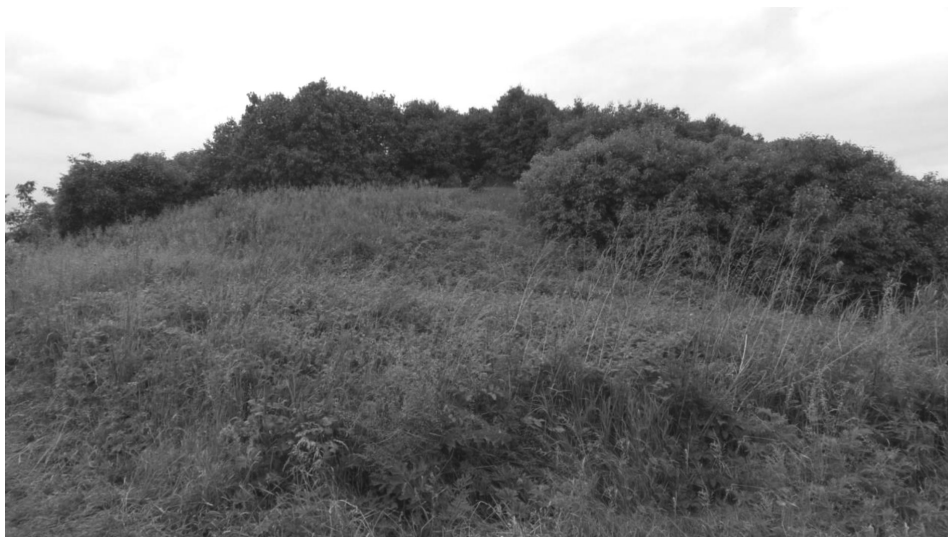
Il. 4. Bnin – grodzisko stożkowate w 2012 r.

oparta na podwalinie z bierwion dębowych, na których posadowiono konstrukcje skrzyniowe wypełnione piaskiem. Stabilizowały one piaszczysty nasyp, który od strony południowej i północnej zabezpieczono dodatkowo palisadowym płotem. Na tak przygotowanym wyniesieniu zbudowana została drewniana wieża mieszkalno-obronna otoczona palisadą, która uległa spaleniowi i jej bryły nie można już odtworzyć. Gruba warstwa spalenizny pozwala sądzić, że była to jednoprzestrzenna, kilkupoziomowa budowla, jakie w tym czasie zaczęto wznosić na ziemiach polskich 20 . Wieże mieszkalno-obronne budowano w zachodniej Europie od 1000 roku (najstarsza z nich to dwór na kopcu hrabiów Blois w departamencie Loir-et-Cher we Francji 21 ). Z terenu północnej Francji idea wznoszenia dworów obronnych została przeniesiona do Niemiec i Danii; ich formy stały się wzorem dla siedzib „panów gruntowych” w państwie Piastów. Jak to ujął Stanisław Kołodziejski: „budowle te wznoszono w centrach prywatnych majątków ziemskich, były funkcjonalnie z nimi związane, zapewniały właścicielom włości mieszkanie i ochronę, a zarazem stanowiły ośrodki administracyjne kluczy majątkowych” 22 . Dodać należy, że