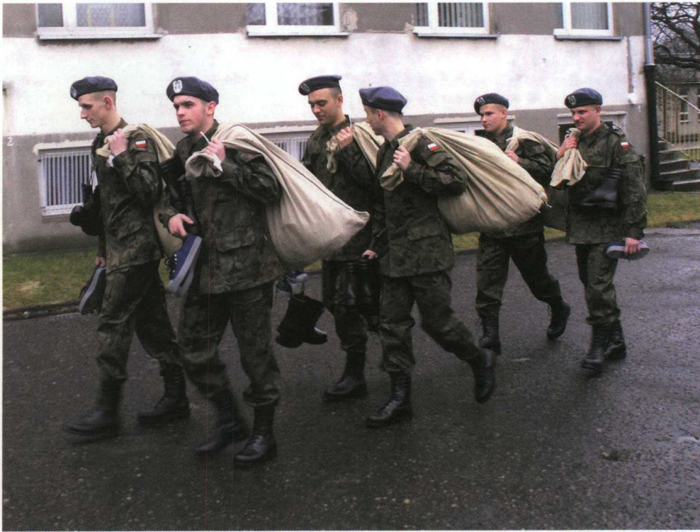
Archiwum Centrum Szkolenia Sił Powietrznych

Zakład Antropologii PAN we Wrocławiu od 40 lat prowadzi cykliczne badania 19-latków, którzy stawiają się w komisjach poborowych. Dzięki tym badaniom możliwe jest systematyczne śledzenie zachodzących w Polsce przeobrażeń społecznych