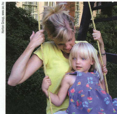
Horton Group, www.ssc.hu

Na wprowadzeniu gospodarki rynkowej skorzystała przede wszystkim klasa społeczna prywatnych przedsiębiorców. Dzieci „posiadaczy” zaczęły nagle przewyższać nawet dzieci z rodzin wielkomięskiej inteligencji