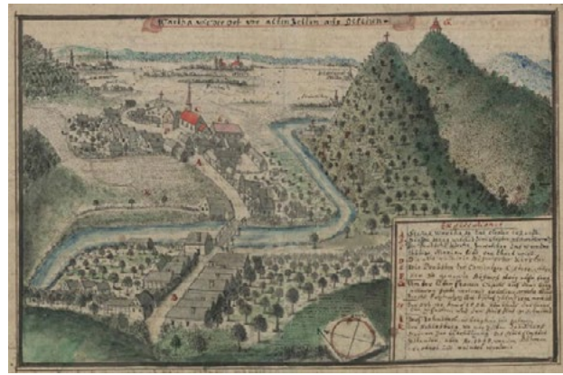
Il. 3. Bardo na rys. F.B. Wenera w poł. XVIII w. Za: F.B. Werner, Topographia seu Compendium Silesiae. Pars II. [...] , (Biblioteka Uniwersytecka we Wrocławiu Oddział Rękopisów, sygn. IVF113b, wol. 2, s. 567).

Wzgórze oplata gęsta sieć stromych dróg i ścieżek przecinających las. Prowadzą nimi trasy pątnicze, przy których stoją kapliczki oraz stacje dróg krzyżowych. Pierwsze z nich wzniesiono w latach 1714–1727, ale zbliżony do pierwotnego kształt zachowały jedynie dwie. Pozostałe powstały w okresie od 1833 do 1839 roku 41 . Dominuje nad nimi barokowa kaplica górska p.w. Najświętszej Marii Panny