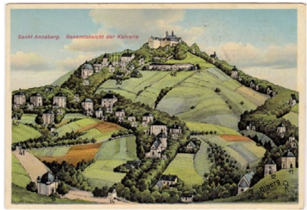
Il. 1. Góra Świętej Anny, pocztówka litograficzna z 2. poł. XIX w.