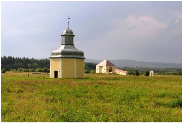
Il. 4. Kalwaria w Krzeszowie, Pałac Heroda (stacja XI), w głębi stacja XII – Dom Schodów i Pałac Piłata. Fot. W. Brzezowski, 2014