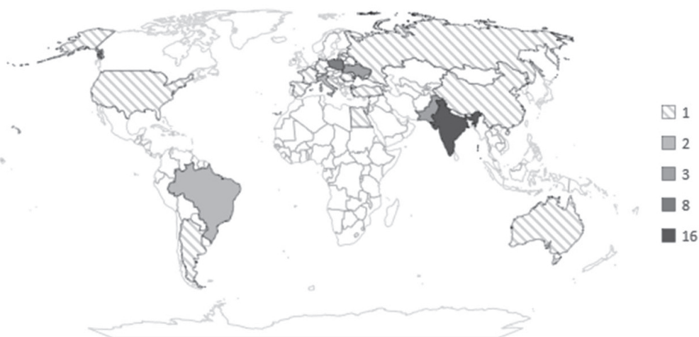
Ryc. 1. Narodowości stypendystów programu PASIFIC z uwzględnieniem ich liczności

W dalszej części pracy omówimy wyniki wybranych projektów. Wybór jest oczywiście subiektywny i służy ilustracji różnorodności prowadzonych prac.