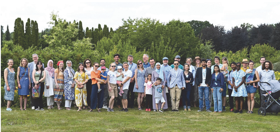
Ryc. 3. Spotkanie networkingowe w Powsinie, 30 czerwca 2023 r.