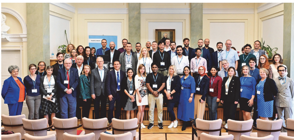
Ryc. 4. Spotkanie networkingowe w Pałacu Staszica ze środowiskiem naukowym i AMU, 25 września 2023 r.