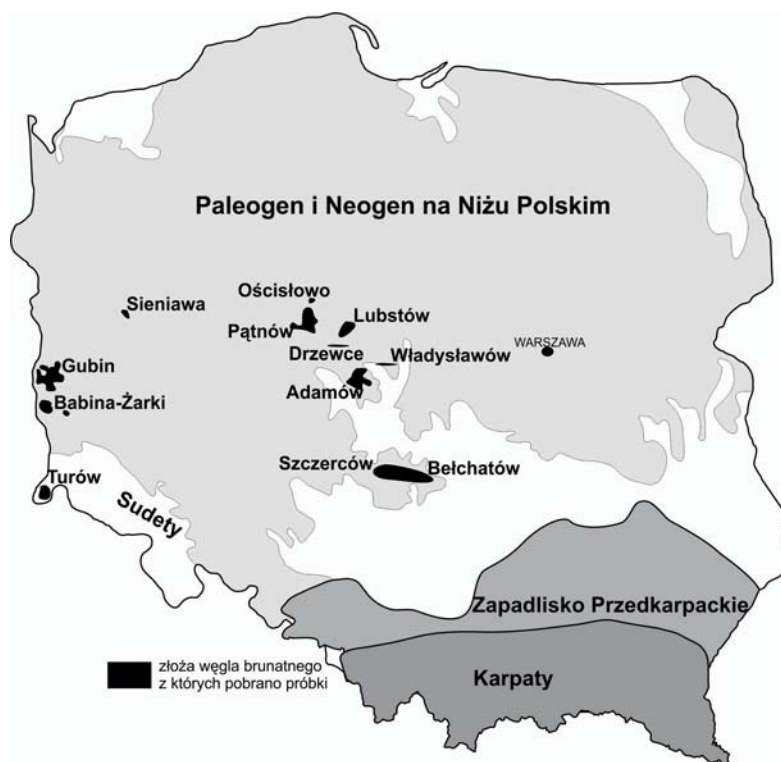
Rys. 1. Mapa lokalizacji złóż węgla brunatnego, z których pobrano próbki do badań (Kasiński i in. 2006; Wagner i in. 2008; uzupełniona)